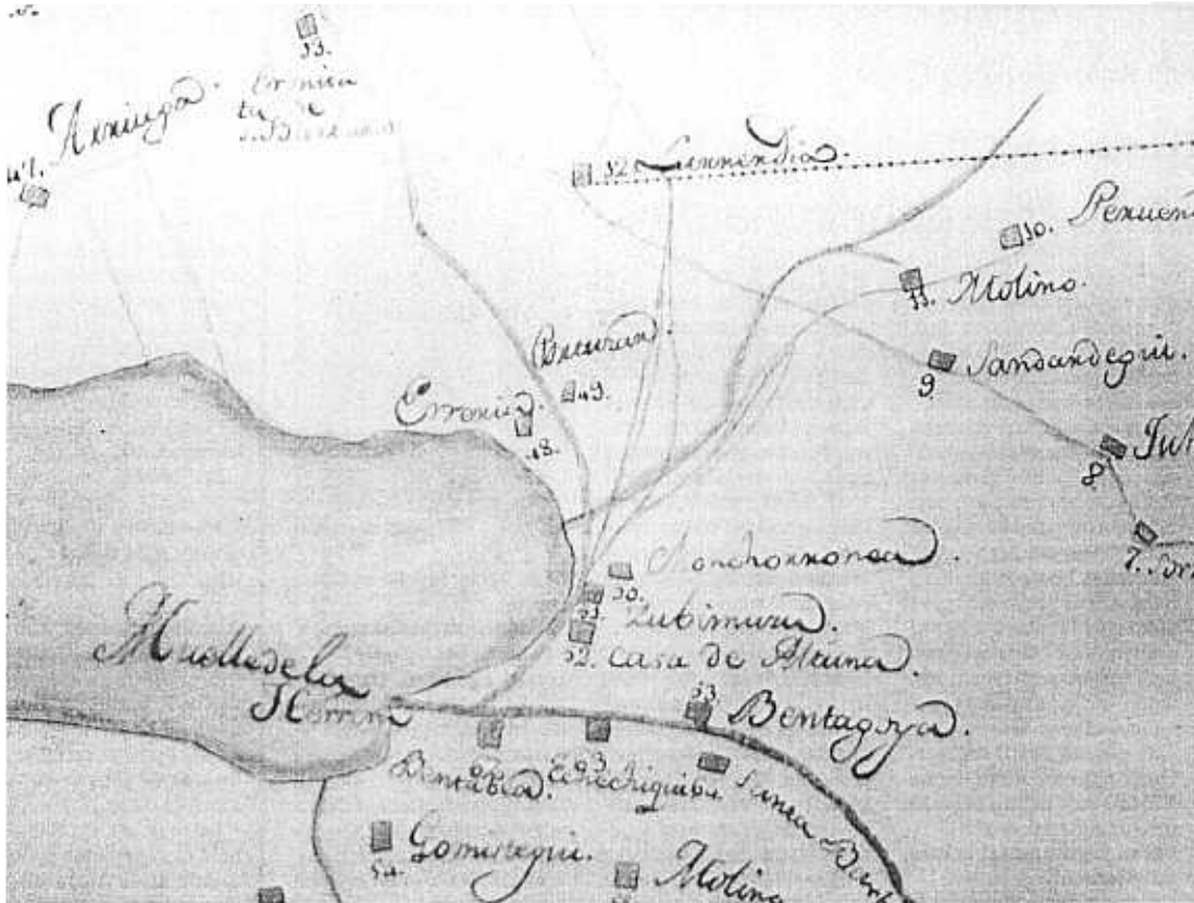
1805ko mapa honen arabera lur hauek Pasaiara dira: Gomistegi, Peruene, Akular, Arriaga... RAJA PEREZ