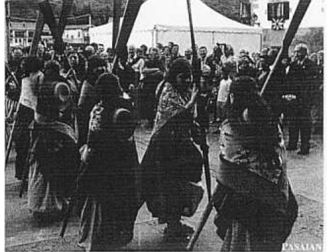
Las bateleras de Donibane bailaron al término del acto conmemorativo.

El Ayuntamiento conmemoró el pasado 3 de junio el bicentenario de la creación de Pasaia como municipio unido e independiente. Lo hizo con dos actos. El primero, que tuvo lugar en el Salón de Plenos del Consistorio, fue la aprobación por unanimidad de una moción encaminada a reclamar para nuestro municipio los límites territoriales que históricamente y por ley le corresponden.