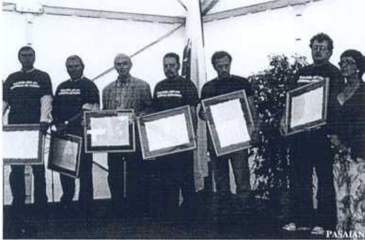
Ex alcaldes recibieron una copia de la Real Cédula por la que se unieron Donibane y San Pedro.