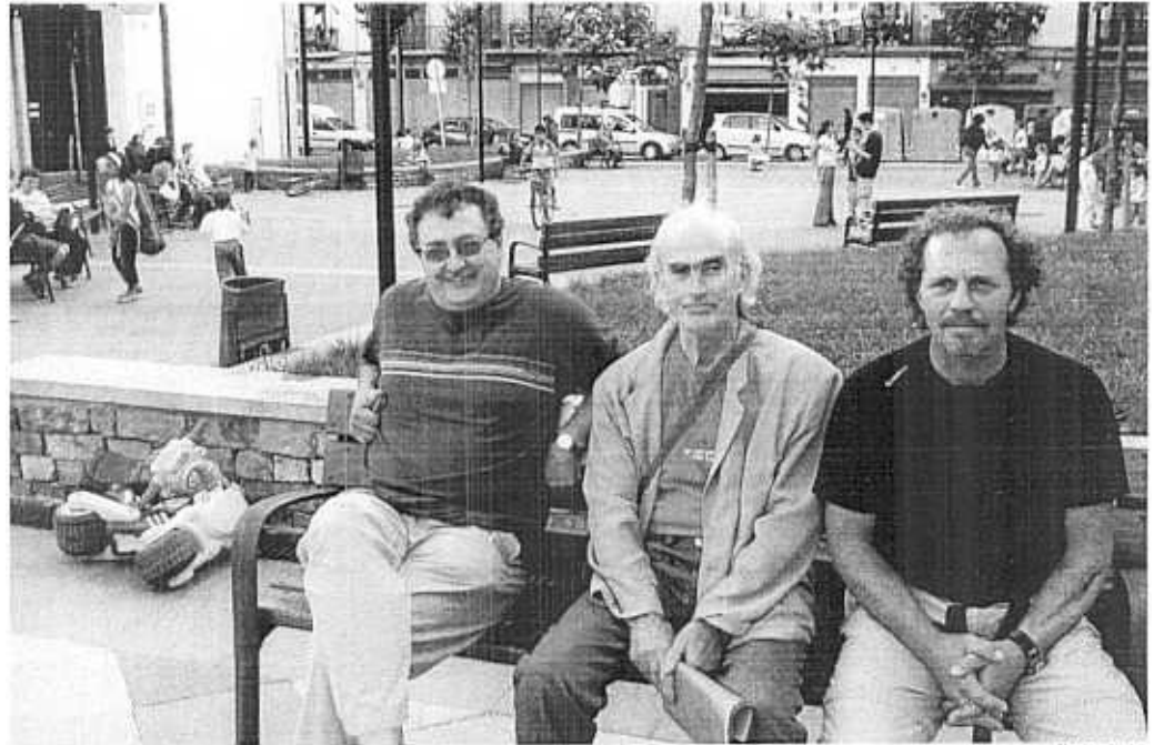
Los tres ex alcaldes mostraron puntos de vista bastante coincidentes en algunos de los temas que tratamos con ellos.