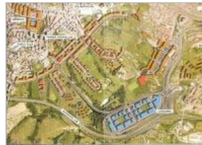
Plano de la zona de Auditz Akular, que se encuentra en la muga entre Donostia y Pasaia.