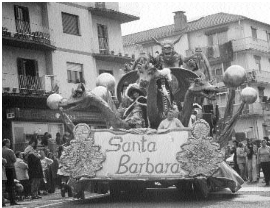
Altza al abordaje

altzatarra han pasado por las diferentes categorías de la competición, pero en general se puede decir que para poder acceder a la categoría de mediana una comparsa debe contar con 80-50 participantes, mientras que las pequeñas cuenta con menos de 50. Con esto podemos hacer un cálculo rápido, el carnaval altzatarra mueve a un promedio de 200 personas. En general jóvenes (chicas mayoritariamente) dispuestos a bailar y a darlo todo por una fiesta que cuenta con el acicate de acercarse a su gente, a los de casa.