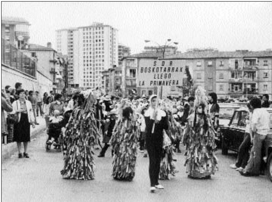
Comparsa de la S.D.R. Boskotarrak

Altzako ihauteriak, duela 20 bat urte ospatzen dira Piñata Igandea delakoan.