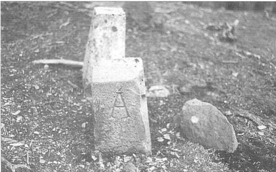
Paraje de Gorostegi. Se aprecia la letra A de Alza en el mojón.

Mojón número 5 - Es de piedra arenisca, de forma irregular y está señalado con una cruz, hallándose fijo en otro pico llamado GOROSTEGUI a los ochocientos cuatro metros del anterior siguiendo la cresta de monte que también los une en dirección al Norte.