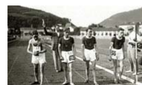
1924. Campeonato de España en Tolosa.