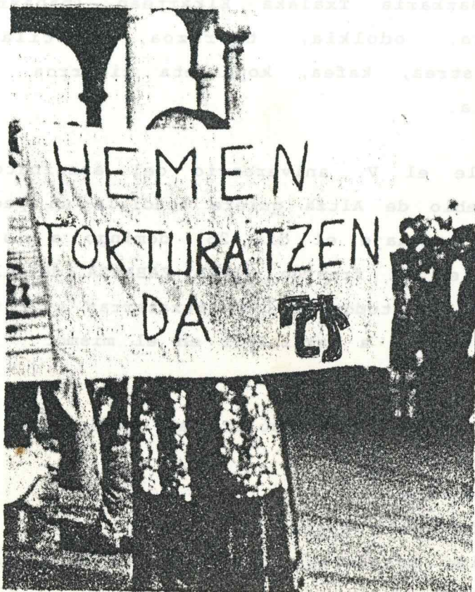
ALTZAKO AMNISTIAREN ALDEKO KOMITEA

GIZON UMILA TXIT MAITE ZENDUN ALAITASUN TA BAKEA ZUK JAKIN GABE GAINEAN ZENDUN HERIOTZAREN KATEA ETSAIEK ZERBAIT BILATU NAHI TA ZURE AURKA SU TA KEA ERRU BAKARRA EDUKI ZENDUN EUSKALDUNA IZATEA.