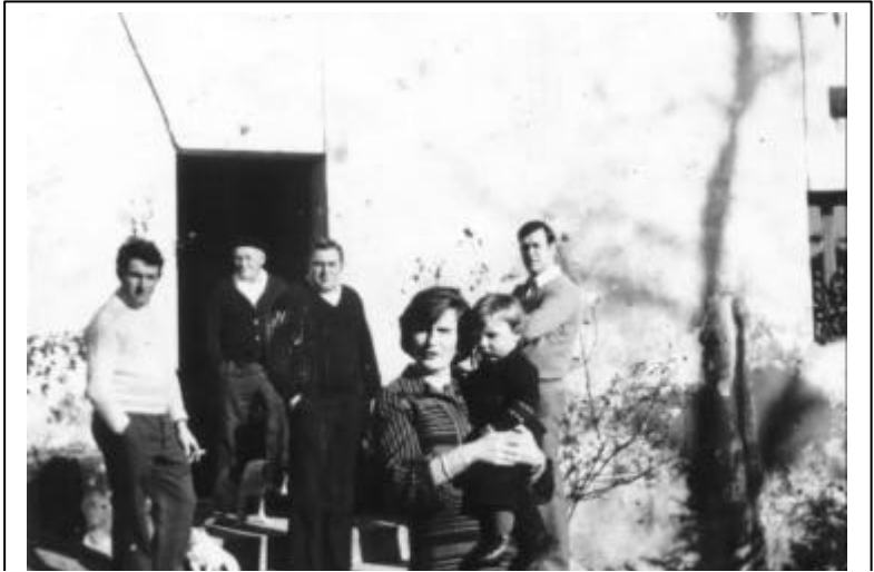
Kastillun baserriko Alkiza familia 1978. urtean

I-122. Aginpidea senar emazteen artean. Eskubide berdinak al dituzte senar-emazteek? Senarraren ahalmenak eta betebeharrak. Emaztearenak.