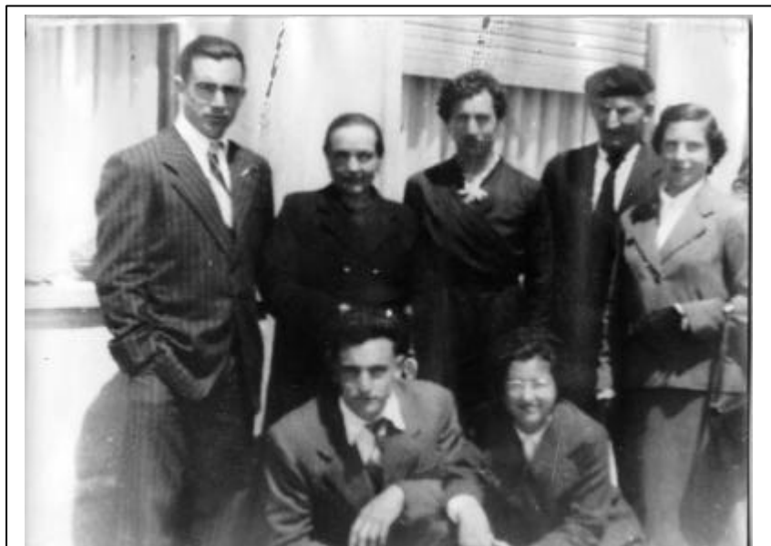
Pelegrinene baserriko Arrieta familia 1956. urtean

Zeremonia berezietan aldiz honako ordena mantentzen da: