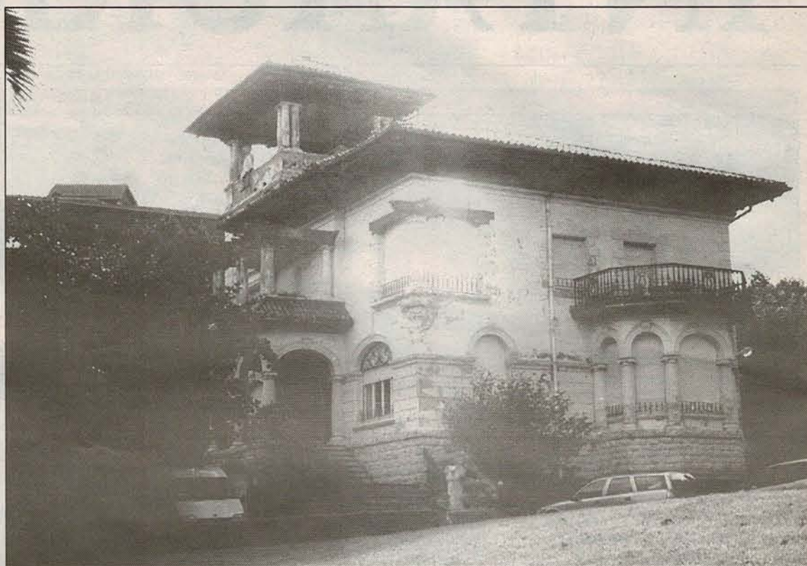
Villa Yeyette acogerá el Centro Cultural Gastronómico de Euskal Herria, iniciativa que apoyan los grandes cocineros vascos

El Ayuntamiento de San Sebastián ha cedido a esta asociación Villa Yeyette -paseo Zubiau-