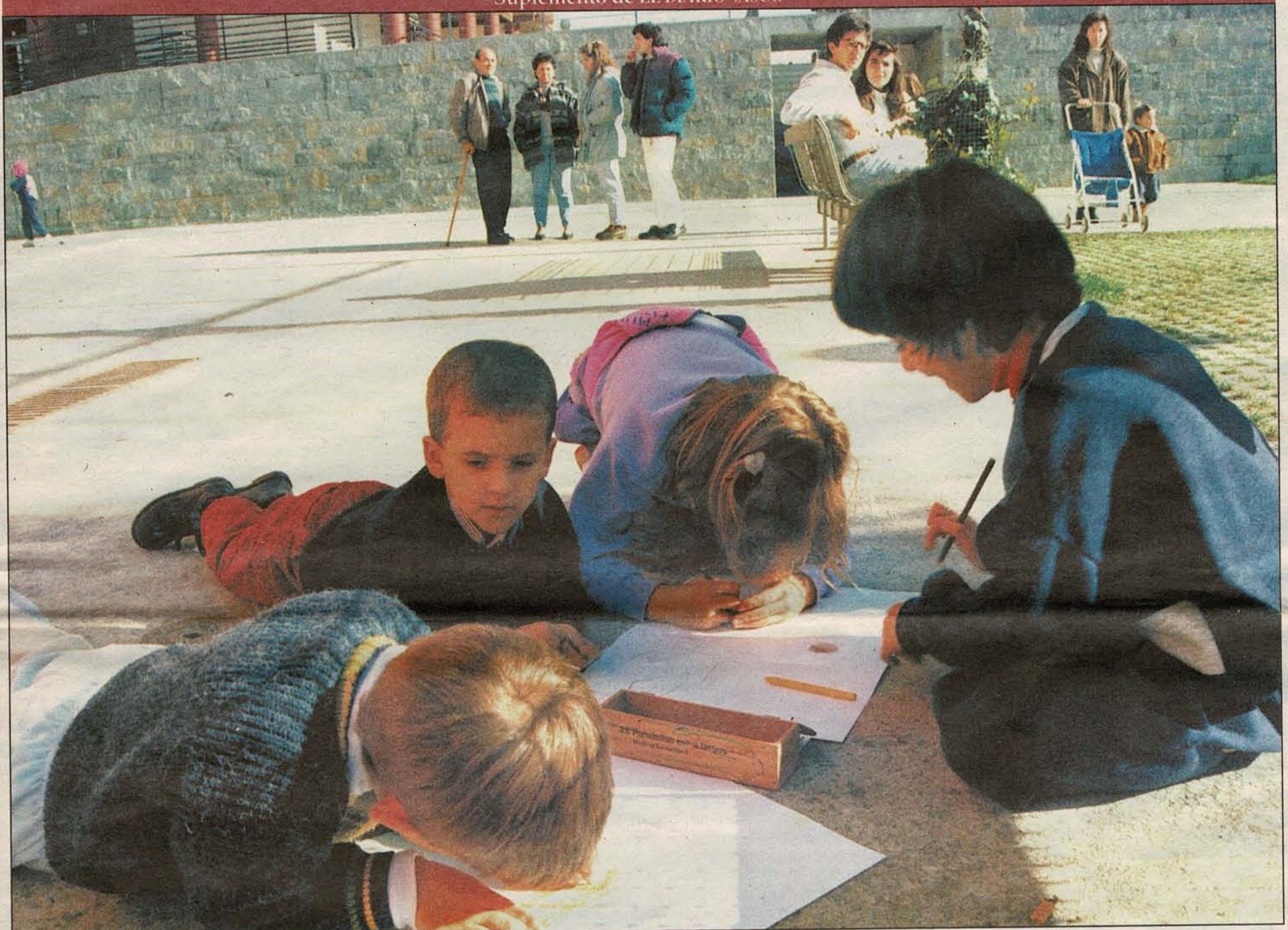
Intxaurreondo es el cuarto barrio más poblado de San Sebastián y el que tiene la media de edad más joven