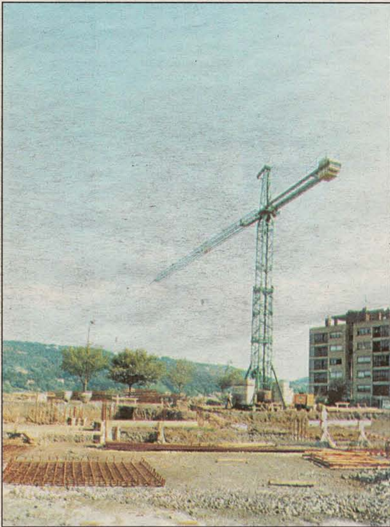
El centro de secundaria estará terminado para el próximo curso escolar

La delegada de Educación afirma que no se ha sobrepasado la capacidad real de la ikastola y que en una semana saldrá a concurso el proyecto del nuevo centro