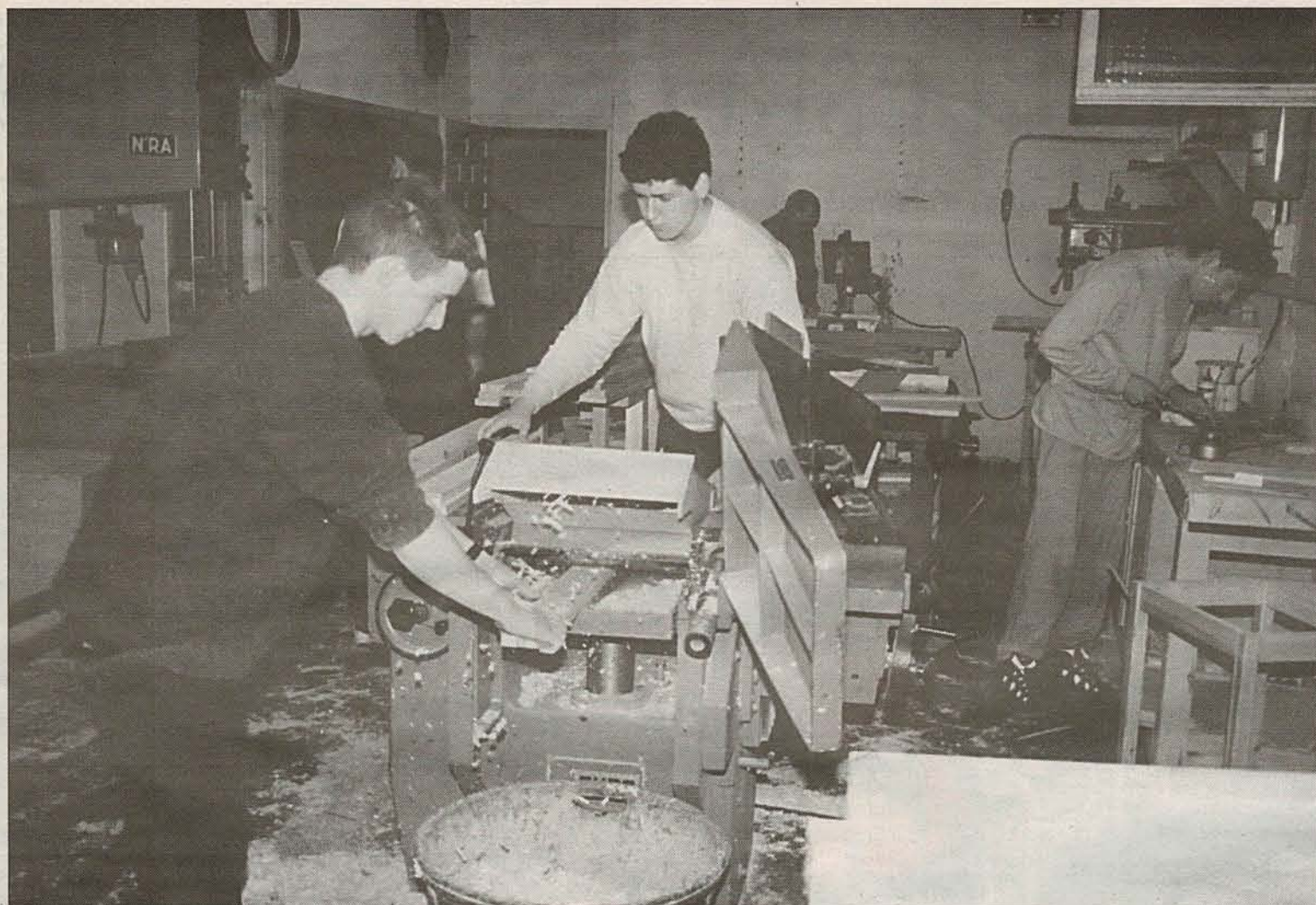
Jóvenes del curso de carpintería, uno de los cinco que se imparten en el Centro de Iniciación Profesional María Auxiliadora