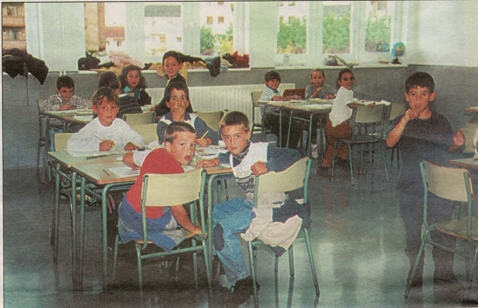
Intxaurreondo es uno de los barrios que más ha crecido en los últimos años y es también el barrio con la población más joven de Donostia

La asociación de padres y a la directiva de la ikastola, apoyadas por las dos asociaciones de vecinos del barrio, Ipar Haizea e Intxaurre, responsabilizan de este problema al Departamento de Educación del Gobierno Vasco que, en su opinión, «ha tenido una total falta de previsión por no haber tenido en cuenta que Intxaurreondo es el barrio con la población más joven de toda Donostia y no haber construido ya el nuevo centro de primaria».