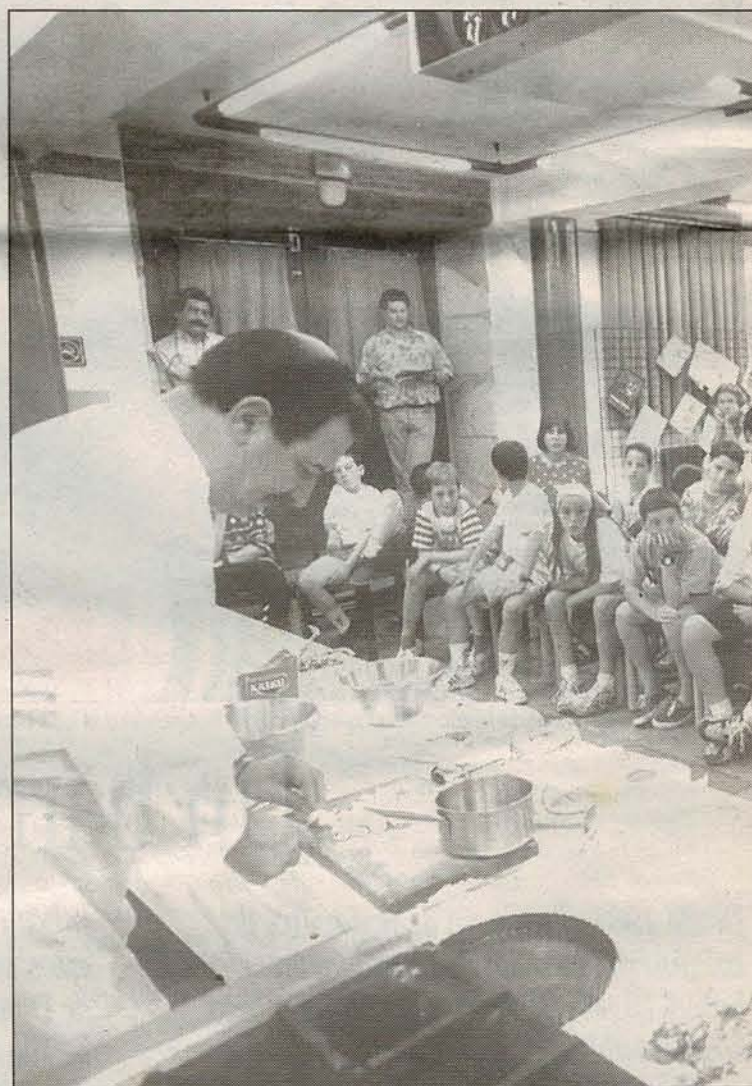
Los niños podrán aprender los secretos de la cocina

El Centro Gastronómico Cultural de Euskal Herria se presentará a los medios de comunicación el próximo 30 de octubre. Los promotores de este ente creen que a finales de año ya se podrá organizar distintas actividades como conferencias y algún curso de cocina cara a las Navidades.