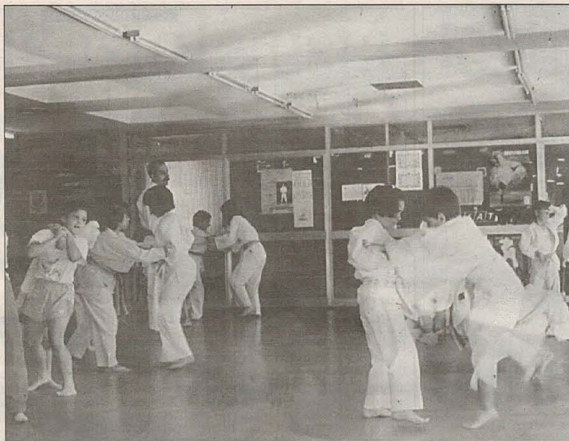
La Asociación de Mujeres Lagunak organiza un curso de judo para chavales de 4 a 14 años

Todos los viernes, a partir del 23 de octubre y hasta el 4 de junio, se celebrará el curso de restauración de muebles . Las clases serán de 18.30 a 21.00 horas.