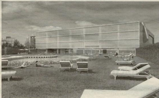
Vista virtual de la piscina exterior del centro cívico de Intxaurreondo, en construcción.

El aumento del coste estaría relacionado, según ha podido saber este periódico, con modificaciones nece-