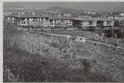
Parcela de la calle Lanberri donde se construirá el campo.