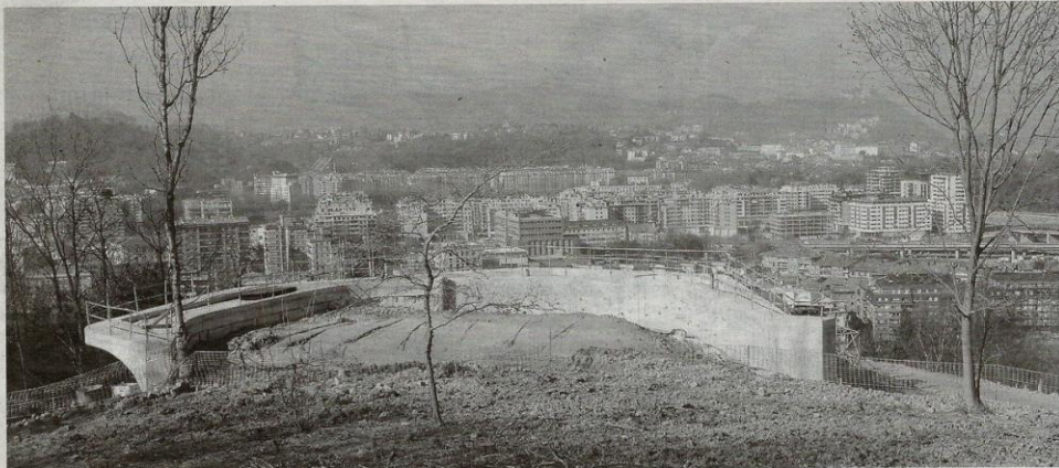
PARQUE. Un aspecto de las obras que se están realizando en el nuevo parque de Ametzagaina.