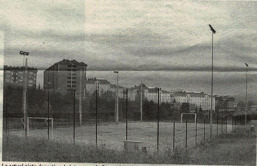
La actual pista deportiva de Intxaurreondo Sur será sustituida por otra más moderna.

"Nosotros queremos unas piscinas de ocio para jóvenes y un vaso que pueda ser utilizado por los adul-