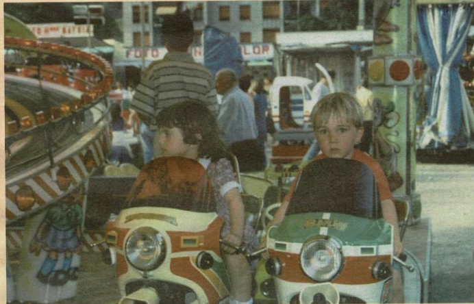
Dos niños disfrutaron de un divertido viaje en una barraca, en fiestas.