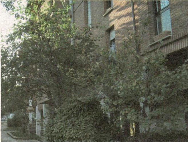
Las ramas de los árboles impiden la visión exterior.