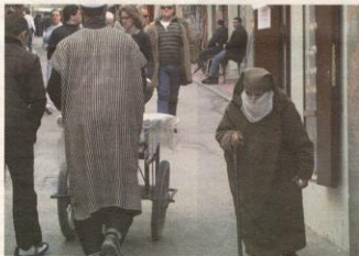
Marruecos, un país con mucho que ver.

El Club Vasco de Camping ha preparado un viaje a Marruecos, Atlas y Sahara durante los días 1 a 11 de diciembre. Son siete días, el precio es de 580 euros dentro del que se incluye autocar-litara y alojamiento en media pensión. El programa completo así como más información se puede adquirir en la sede del club, en la calle Iparragirre, 8.