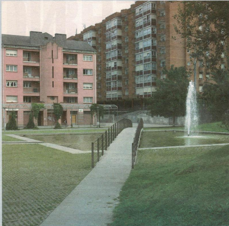
En el parque no se ve estos días un alma por el temor de los vecinos.