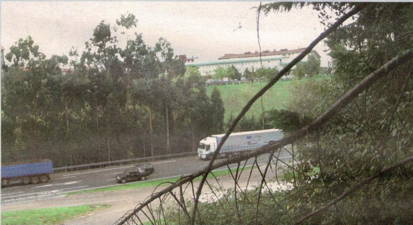
A los vecinos de Intxaurreondo les gustaría que hiciesen un campo de fútbol.

Además, a los vecinos les ha parecido muy poco tiempo el plazo dado por Ayuntamiento de Donostia para presentar una serie de reflexiones ante el Plan Estratégico Deportivo 2006-2013. «El alcalde nos ha mandado un escrito para presentar nuestras ideas, pero nos ha dejado tan sólo unos pocos días para pensar ello», se quejan desde la asociación.