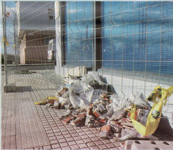
Los vecinos denuncian la peligrosidad de algunas viviendas.

Además de estos desperfectos también se han desprendido las repisas de dos balcones y el resto de ellos están muy agrietados lo que supone un riesgo muy peligroso. Asimismo las terrazas de la cubierta tampoco están en buen estado y por otra parte, hay unas vigas que atraviesan perpendicularmente la fachada y se están reventando en muchos puntos porque el revestimiento es escaso y la varilla interior se oxida y revienta. Los vecinos quieren hacer pública su preocupación y esperan que algún responsable se interese por ellos y les pueda ofrecer soluciones para sus graves problemas.