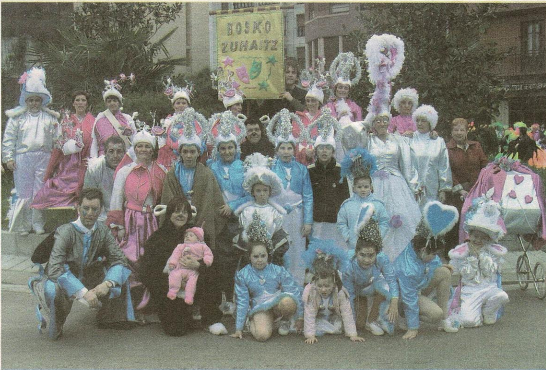
Los miembros de la comparsa Bosko Zuhaitz en los carnavales del año pasado.

Para más información se puede llamar a los teléfonos 669174183 ó 627421124.