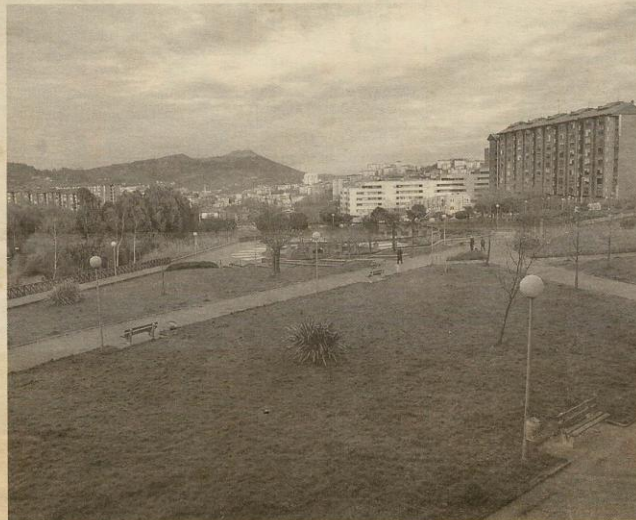
El parque de Siustegi en Intxaurrondo Sur, donde se ubicará el centro deportivo-cultural.