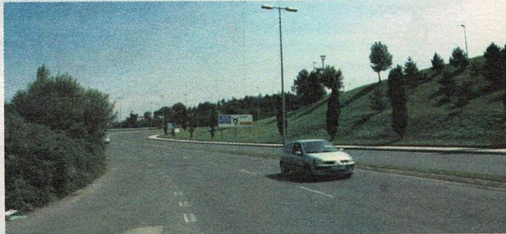
Los coches rompen farolas en el Paseo de Otxoki.

Los vecinos han denunciado en numerosas ocasiones el exceso de velocidad con el que circulan los vehículos, pero hasta el momento nadie ha hecho nada por subsanarlo. «En otras zonas