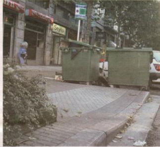
Una acera de una calle de Amara.

El objetivo que el Ayuntamiento persigue con la creación de estos "puntos limpios" es impulsar políticas activas de reciclaje y reutilización de los residuos inertes siguiendo las directivas europeas, con el propósito de reducir el volumen en los vertederos. Su desarrollo está firmemente ligado a la necesaria concienciación y colaboración de los ciudadanos.