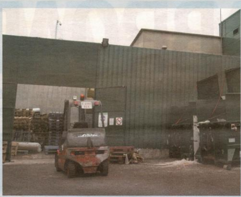
El Garbigune de Garbera en Intxaurreondo.