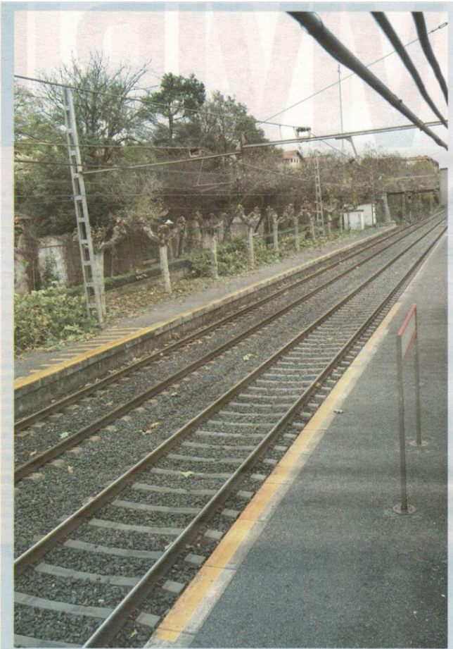
El cubrimiento de las vías del tren sigue dando que hablar.