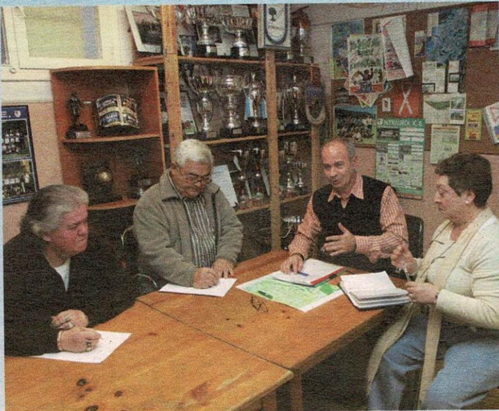
Los vecinos, reunidos en la asociación.

Otra de las cuestiones que preocupan a algunos vecinos es la ubicación de las nuevas instalaciones, ya que donde se van a construir atenderían a la oferta deportiva y cultural de Intxaurreondo Norte, pero quedarían bastante alejadas de los vecinos de Intxaurreondo Viejo, a los que quizás les queda más cerca el polideportivo Zuhaitzi de Gros. Y es que hay que tener en cuenta que este barrio es uno de los más populosos de Donostia y quizás no es fácil una ubicación a la que puedan acceder fácilmente todos los vecinos.