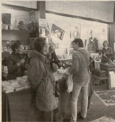
Un aspecto de la tienda en ediciones anteriores.