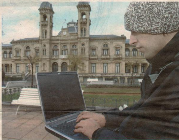
Un joven, con su portátil ayer, en Alderdi Eder, una de las zonas Wi-Fi gratuitas de Donostia.

En opinión de Alonso, la tarifa de un día, "especialmente útil para visitantes, es exageradamente cara". A este inconveniente, el catedrático suma el interrogante sobre la viabilidad