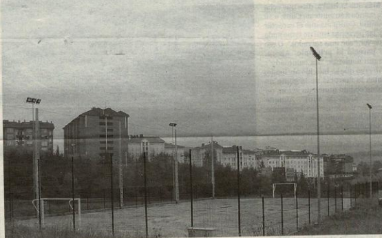
La pista deportiva de Intxaurreondo, en el paseo de Otxoki.

El Ayuntamiento decidió levantar la nueva pista en el paseo de Otxoki, junto a las dependencias de la