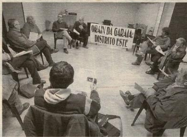
Un momento de la reunión en Intxaurrendu. [MICHELENA]

Estos distritos se considerarían divisiones territoriales propias dotadas de órganos de gestión descentralizada. «No queremos que el Ayuntamiento distribuya los distritos a su manera, sin contar con nosotros. Queremos que el distrito se convierta en un medio de participación ciudadana real y que contribuya a un mayor desarrollo social y económico en la zona. Este modelo ya se ha implantado en Sevilla, Bilbao o Vitoria. En nuestro caso, el distrito Este podría estar compuesto por cerca de 45.000 habitantes, una cuarta parte del censo municipal. De momento, somos la única plataforma que se ha creado en la ciudad», comenta otro miembro de Ekialde.