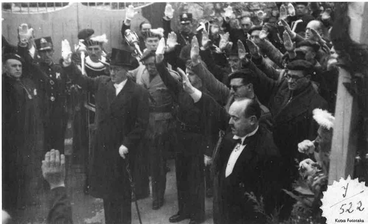
Anexioaren ekitaldi publikoa Intxaurrondon, Donostiako mugan egindakoa. 1940. Acto público de anexión en Intxaurrondo, en el límite con San Sebastián. 1940

Altzak, herri independentea izan baino lehen, independentzia ekonomiko handia izan zuen, baita bertako ordezkari politiko propioak ere. Horrek guztiak udal autonomia handia ematen zion herri gisa.