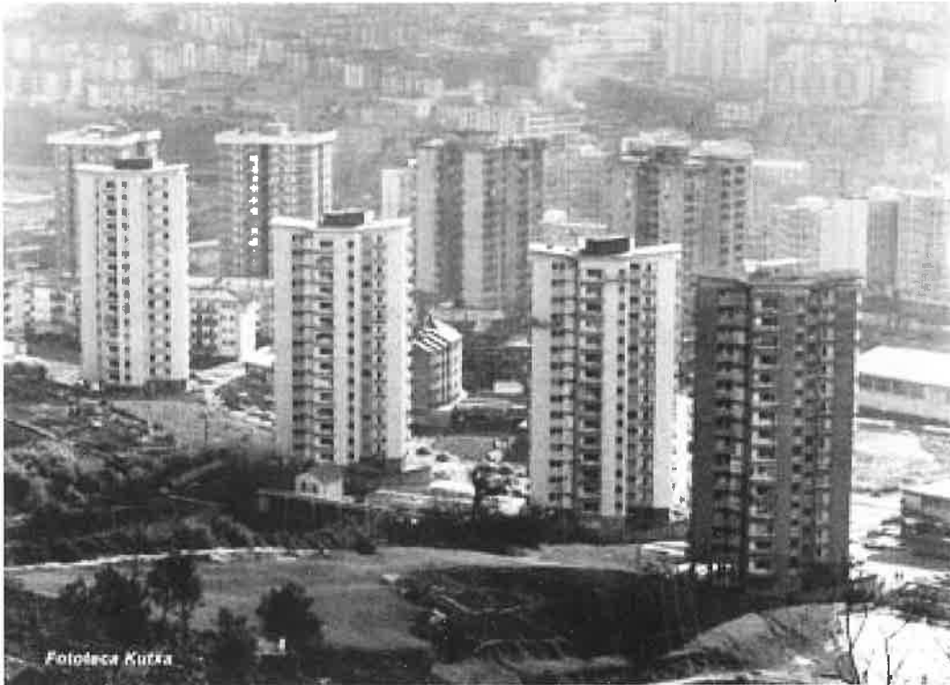
Bidebietako ikuspegia Vista de Bidebieta desde Mendiola. 1960-1970

Eta mila eta ehun haur baino gehiago zeuden bertan eskolatuta.