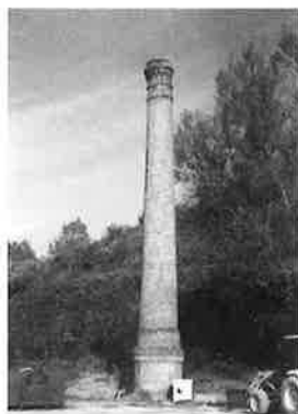
Usoz anaien txapela fabrikako tximinia. 1926n eraikia. Molinaon. Chimenea de la fábrica de boinas Usoz Hnos. Construida en 1926. Molinao.