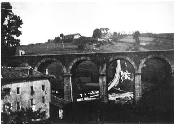
Vista de Herrera. 1908

Altza ha pasado en 70 años de tener una población de algo más de 7.000 habitantes a más de 48.000 en un territorio de 12 kilómetros cuadrados.