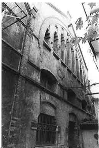
"Lusa y Cia" upa-oholen lantegia. 1912tik martxan. Buenavista. Fábrica de barriles de madera "Lusa y Cia". En activo desde 1912. Buenavista.

Bazituen, halaber, kautxu, birkautxuztaketa, aiztogintza, domino eta likore lantegiak, beste hainbaten artean.