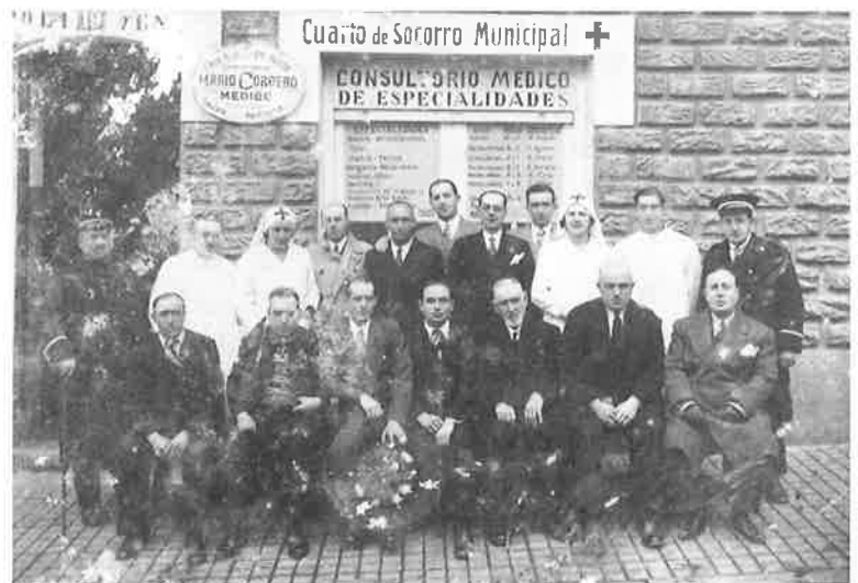
Herrerako Udal Sorospen-Etxeko langileak eta udal ordezkariak. 1930.. Personal del Cuarto Socorro de Herrera y representantes municipales. 1930.