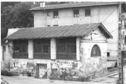
Altzako hiltegia. 1924an zaharberritua. Molinaon. Matadero de Altza. Reformado en 1924. Molinao.

Tenía servicio de matadero, mercado, bomberos, médicos, practicante y Cuarto de Socorro.