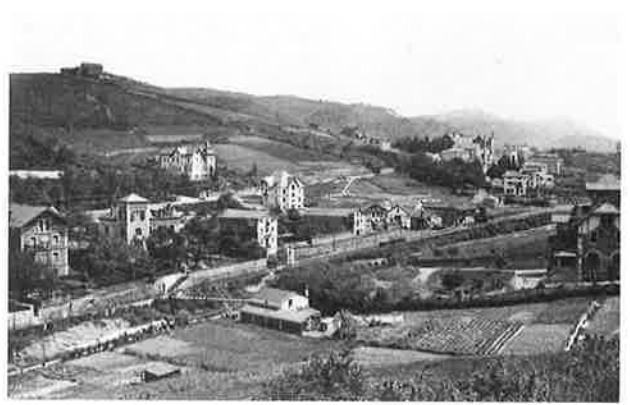
Miracruz gaina eta Intxaurrendoko ikuspegia. 1910-1920. Vista del Alto de Miracruz e Intxaurreondo. 1910-1920.

Érase una vez un conjunto de caseríos diseminados por un amplio territorio al Este de Donostia, entre la ribera del Urumea y el puerto de Pasaia.