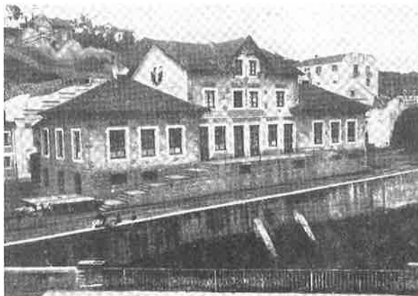
Buenavistako herri eskola. 1915. Escuela pública de Buenavista.