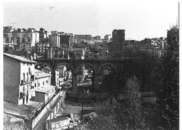
Herrerako ikuspegia. 1970-1980.