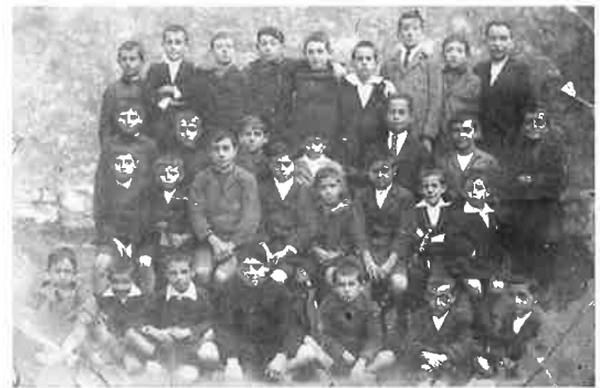
Herrerako La Salle Ikastetxeko ikasle taldea . 1923. Grupo de alumnos de La Salle de Herrera.