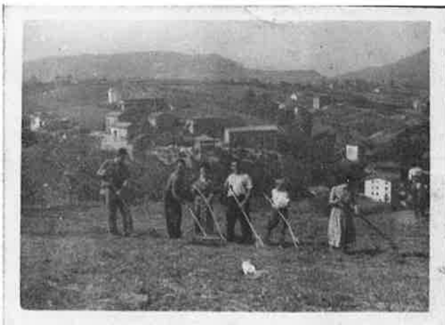
Iparragirretarrak belarretan. 1950 aldean. Los Iparragirre trabajando la hierba. Hacia 1950.

Sus habitantes se dedicaban básicamente a las labores del caserío,