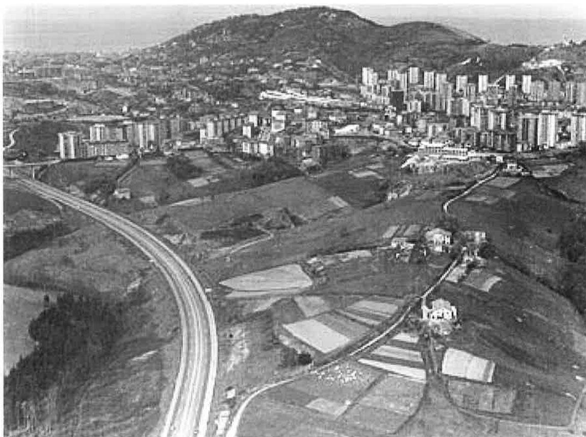
Auditz-Akularreko ikuspegi partziala. 1981. Vista parcial de Auditz-Akular. 1981.

Ayuntamiento del Municipio de Altza. 1915.