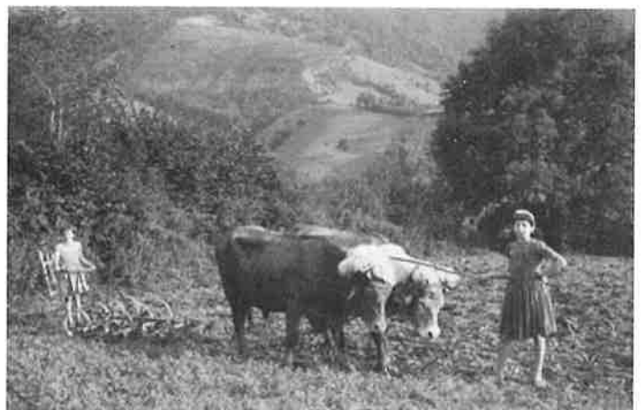
Bi neska idi pare batekin soro bat goldatzen. 1959. Dos mozas con una yunta de bueyes arando un campo. 1959.