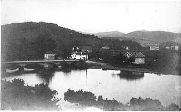
Sarruetako ikuspegia. 1910. Vista de Sarrueta.

Bazen behin baserri sorta bat Donostiako Ekialdeko lur eremu zabal batean barreiaturik, Urumearen ertza eta Pasaiaiko portuaren artean.