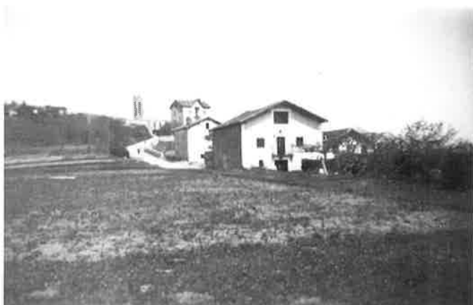
Martilun baserría. 1950 inguru.