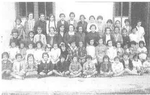
Nesken eskola taldea. 1924. Grupo de alumnas.

Y tenía a más de mil cien niños y niñas escolarizados.