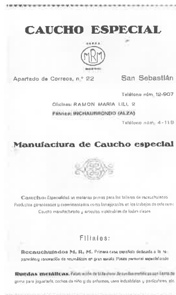
MRM kautxu lantegiaren iragarkia. Intxaurrondon 1930etik. Anuncio de la fábrica de caucho MRM. En Intxaurrondo desde 1930.