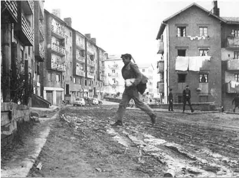
Postaria Santa Barbara auzunean lokatzean ez zikintzeko ahaleginak egiten. 1960-1970. El cartero intentando no llenarse los zapatos de barro. Santa Bárbara. 1960-1970.

El afán constructivo fue tal que dio lugar a un urbanismo caótico y masivo que se hizo sin tener en cuenta las necesidades mínimas de equipamientos ni zonas libres y que, en algunos casos, incumplieron la legalidad.