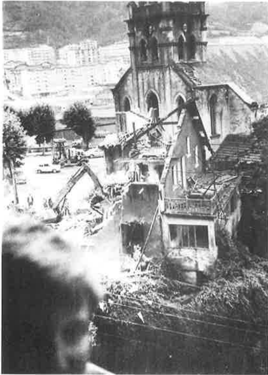
San Luis Gonzaga elizaren eraistea. 1972 Demolición de la iglesia de San Luis de Herrera. 1972

Horrek ondorio argi bat izango luke: Altzaren lur eremuaren, identitatearen eta etorkizunaren behin betiko suntsiketa.