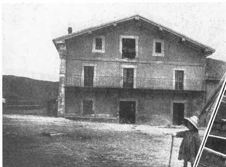
Altza herriko Udaletxea. 1915.

que, en parte del siglo XIX y hasta 1940, pertenecieron al MUNICIPIO DE ALTZA, contando con Ayuntamiento propio.