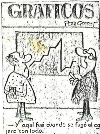
—Y aquí fue cuando se fugó el cajero con todo.