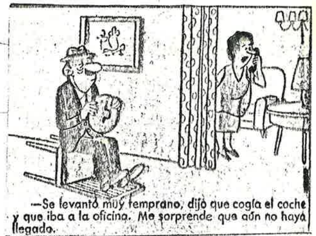
—Se levantó muy temprano, dijo que cogía el coche y que iba a la oficina. Me sorprende que aún no haya llegado.