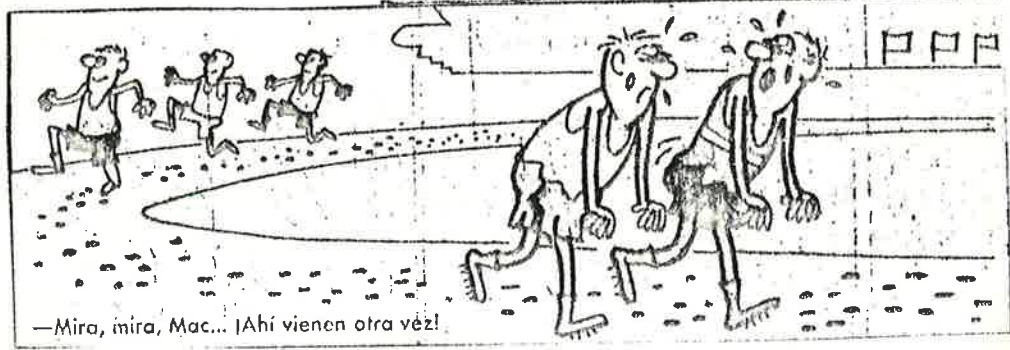
—Mira, mira, Mac... ¡Ahí vienen otra vez!