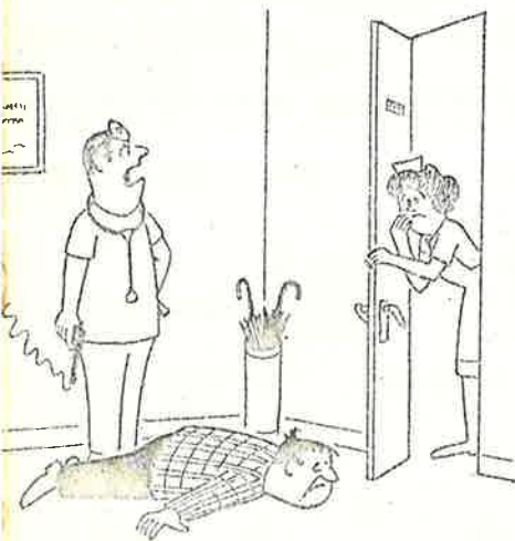
Cuando yo diagnostico que alguien no tiene más que seis meses de vida, son seis meses.