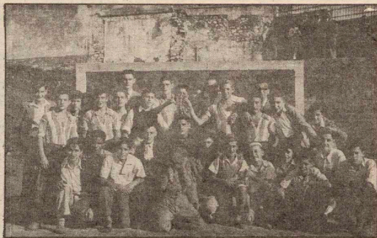
Colocación de la primera piedra de las viviendas de Alza, en 1966. Al lado, el primer grupo de chicos de «Los Boscos», en 1947.

Fundado en 1947, comenzaron sus actividades con una escuela nocturna para jóvenes. - Mediante una cooperativa lograron levantar en 1967 cerca de 120 viviendas en Alza. - En la actualidad ayudan a parados e inmigrantes