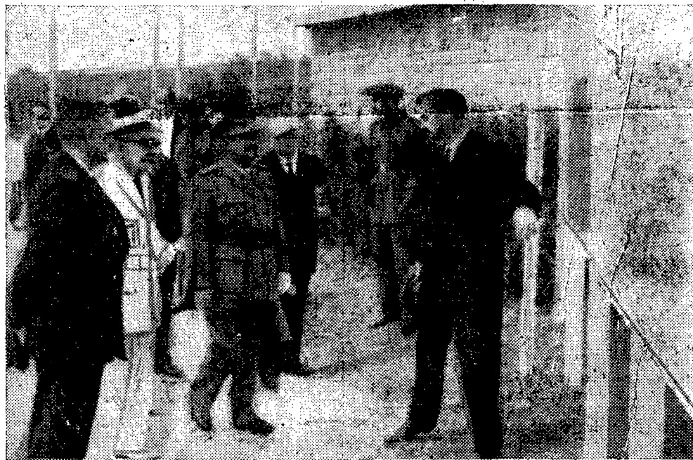
El Jefe del Estado en el acto inaugural de la nueva traida de aguas a San Sebastián, en Ategorrieta.

donde se halla enclavado el depósito de Mons, en Ategorrieta, cerca de San Sebastián. Venía acompañado por el jefe de su