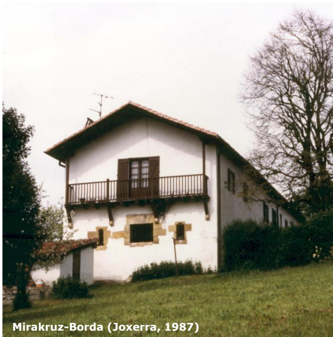
Miracruz-Borda (Joxerra, 1987)