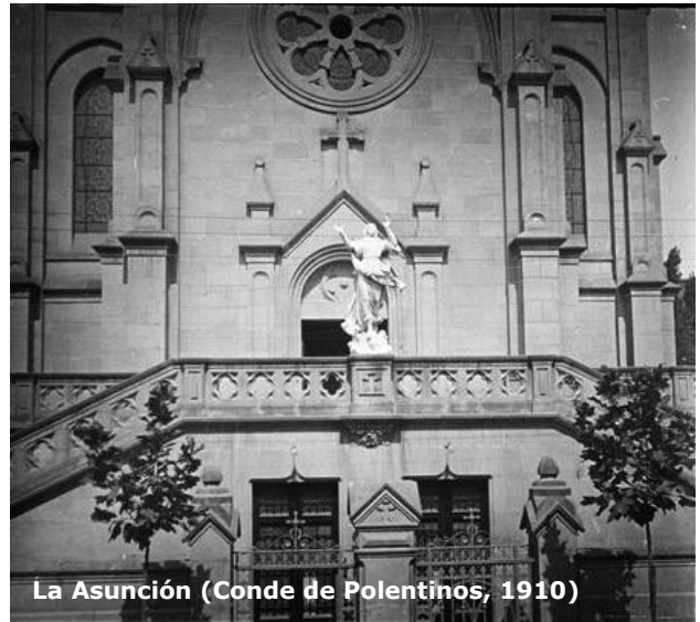
La Asunción (Conde de Polentinos, 1910)