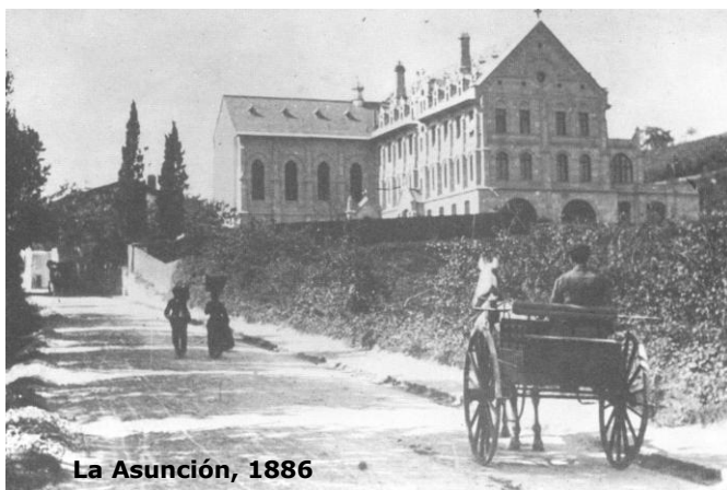
La Asunción, 1886

El nuevo edificio, de estilo neogótico, será diseñado por el arquitecto francés Mr. Sanson, tomando como modelo el colegio parisino de la Congregación en Auteuil, pero la ejecución se realizará bajo la dirección de los arquitectos Echave y Cortázar.