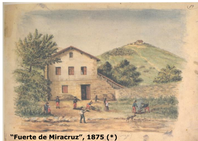
"Fuerte de Miracruz", 1875 (*)