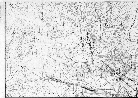
HERNANI (CON EL FUTURO PUENTE DE LIZO-S. JUAN).