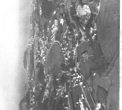
LA DEBERECADURA DEL URUMBU Y LA SIERRA DE LA COMARCA. AUNQUE LAS MONTAÑAS SON LAS MAYORES QUE SE DEBIERAN ENCONTRAR EN EL TERRITORIO COMARCAL.