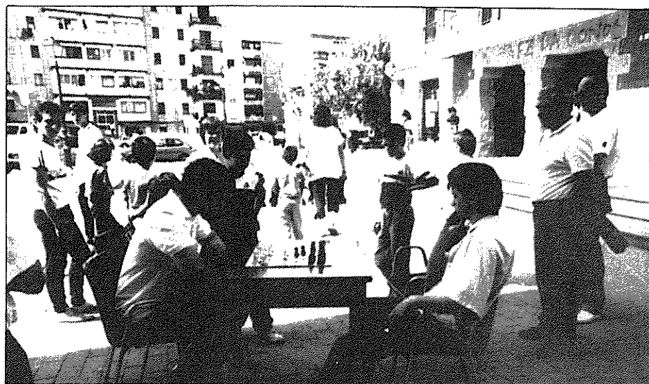
El diseño de las piezas se ha inspirado en el de otro ajedrez similar ubicado en la ciudad de Lausana.

Las fichas han sido construidas en madera resistente, lacada en blanco o negro, para darles consistencia dado que estarán ubicadas al aire libre. Estas piezas han sido realizadas en una carpintería del barrio de Alza. Su altura es de medio metro, arriba o abajo, según la jerarquía de cada una.