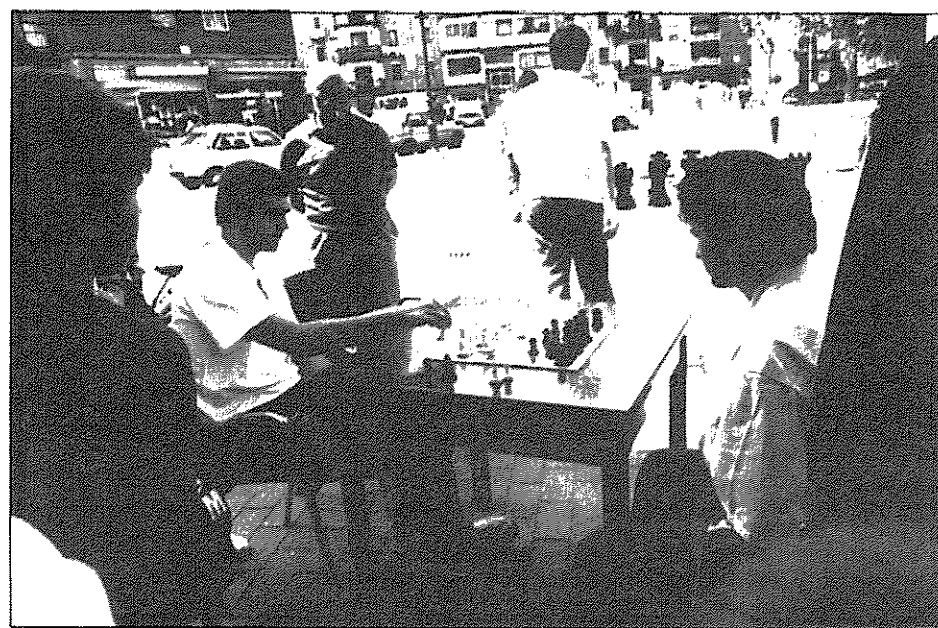
Las dimensiones del tablero son tres metros por tres.

ha supuesto la creación de este recuadro y sus correspondientes ejércitos ha sido de 400.000 pesetas. La Casa de Cultura de Alza ha sufragado la construcción de las fichas mientras que el tablero ha sido financiado por el departamento de Mantenimiento Urbano. El tablero es el mismo suelo de la calle, en el que se han incrustado baldosas de dos colores, que conforman los 64 cuadros necesarios para el juego. En total, el embaldosado conforma un cuadrado de tres metros de