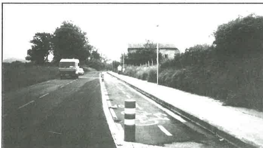
ALTZA efinez 7

El bidegorri que debiera unir Lizarpe con Lau Haizeta es una de las reivindicaciones que se hicieron con la construcción del Eroski de Garbera. Sin embargo el paseo rojo que nos han puesto ni es bidegorri ni es nada. Más parece un paseo para hacer la compra. Sobre los pivotes que lo delimitan con la carretera mejor no decimos nada.