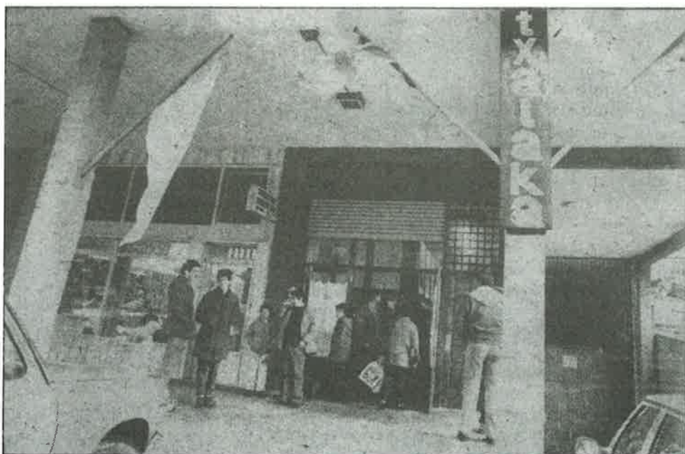
Inaugurada la sociedad «Txalaka» en el barrio donostiarra de Altza.—

11 urte igaro dira Txalaka Elkarteak sortu zenetik. Urte hauetan guztietan Txalakak eman digun babesa eta aukera desberdinak gutxitan baloratu izan ditugu bere neurrian. Belaunaldi berriak agertzen ziren heinean, bere lehenengo asmoak, helburuak, arazoak... denbora berrietara moldatzen joan dira eta Txalaka berri bat osatzen joan da, Altzarekin batera egokituz.