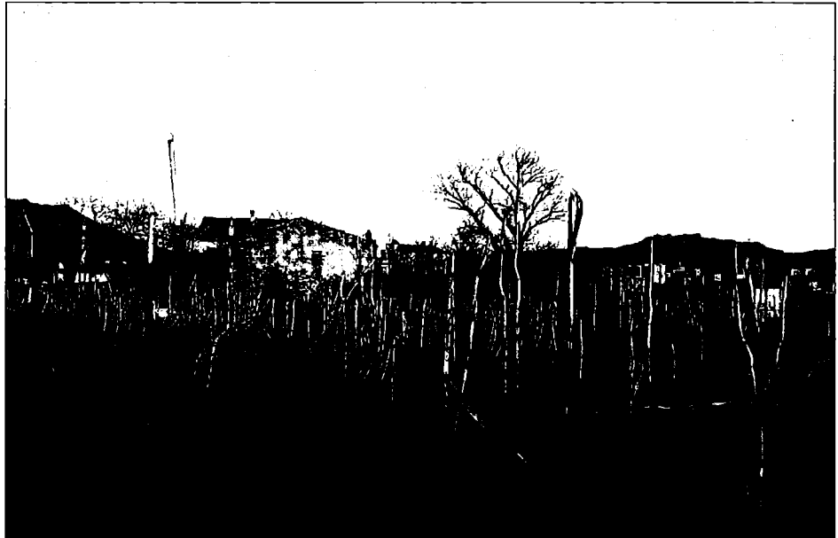
La casa Berra, situada en el Alto de Buenavista, data del siglo XVI y será convertido en centro de día.

La residencia para personas no válidas dispondrá de 140 plazas y se ubicará en un nuevo edificio, que se