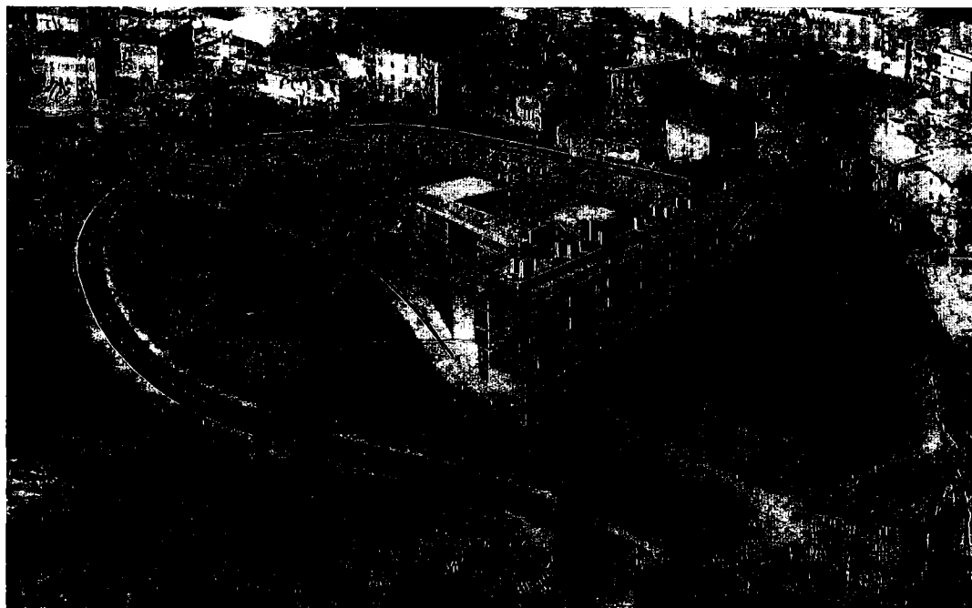
Fotomontaje del centro para mayores de Berra, situado en Alza, junto al paseo de Darieta. Combina residencia, centro de día y apartamentos.