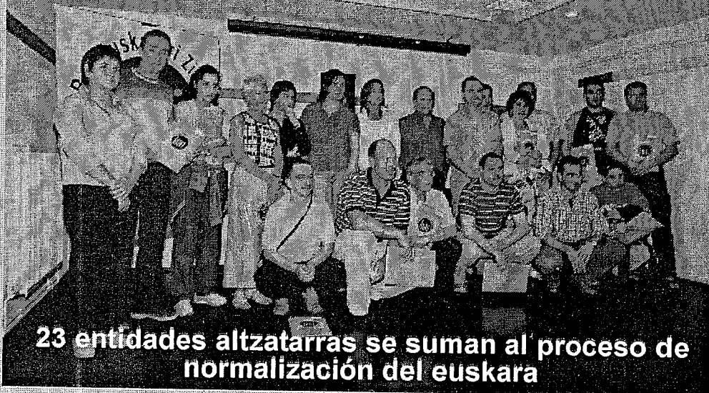
23 entidades altzataras se suman al proceso de normalización del euskara