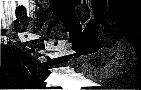
Bizarrainek elkarlanerako hitzarmenak sinatu zituen Donostiako Udalarekin eta Kontseiluarekin