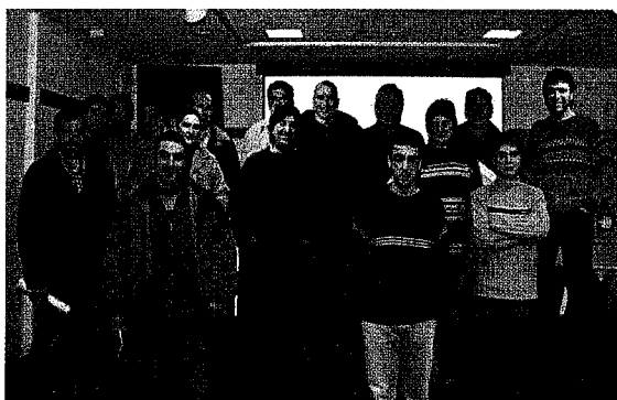
2. Faseko partehartzaile batzuk