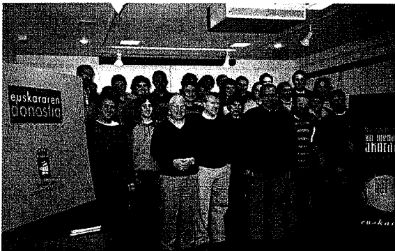
1. Faseko partehartzaile batzuk

E uskararen aldeko konpromiso prozesu bat bideratzen ari gara Altzan, bertako euskalgintzak bultzatu, gizarte eragileek protagonizatu eta Donostiako Udalak lagundu eta babesten duelarik. Gure helburua: euskarak garapen osoa eskuratzea bizitzaren esparru guztietan.