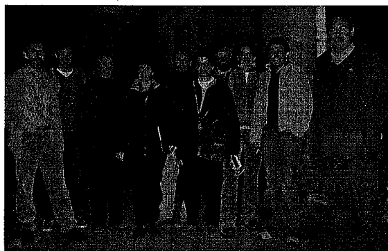
Prozesuaren Zuzendaritza: Jarraipen Batzordea

Tel: 943 397 464 / faxa: 943 396 494 / bizarain@hotmail.com