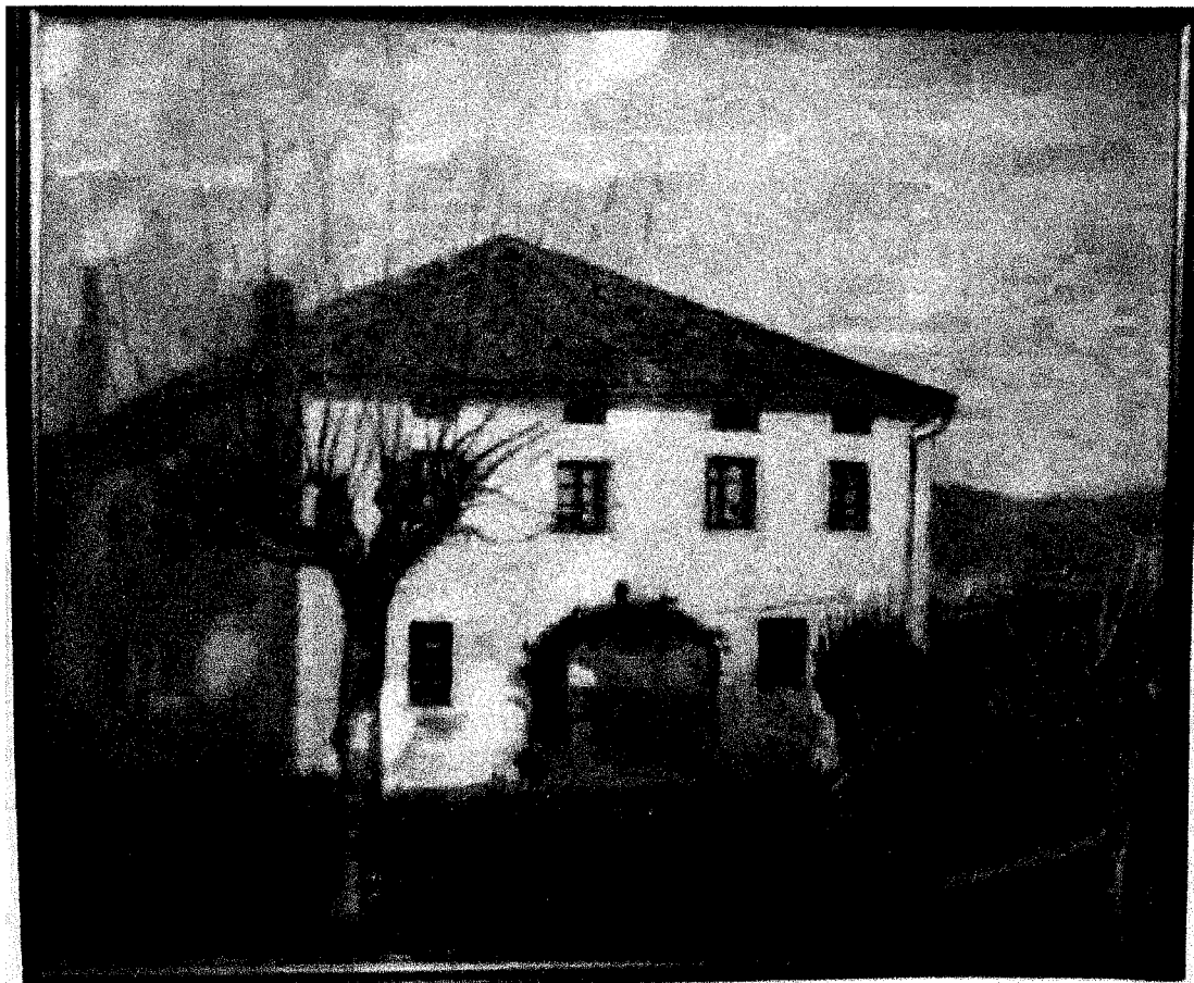
Caserío Casanao 1