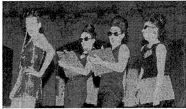
Kontadores Gaztegunea Martuteneko Gaztelekua