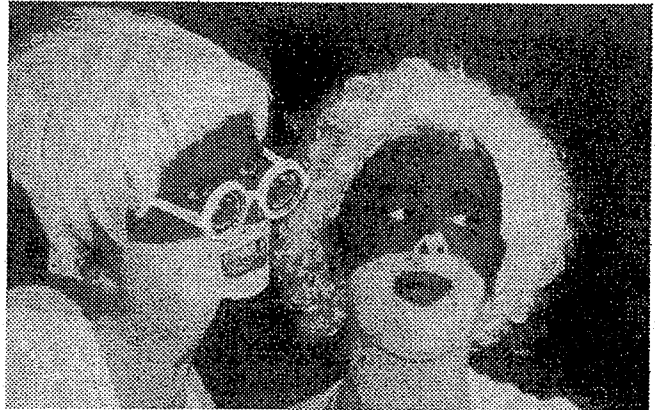
Centro Joven Kontadores Gazteleku de Martutene