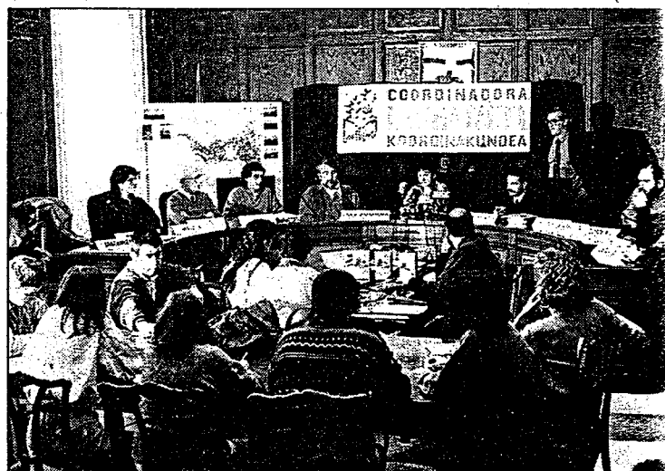
Los representantes de vecinos y asociaciones, en la presentación.

cos en la propuesta y animaron a todos los donostiarros a apuntarse y apoyar la coordinadora.