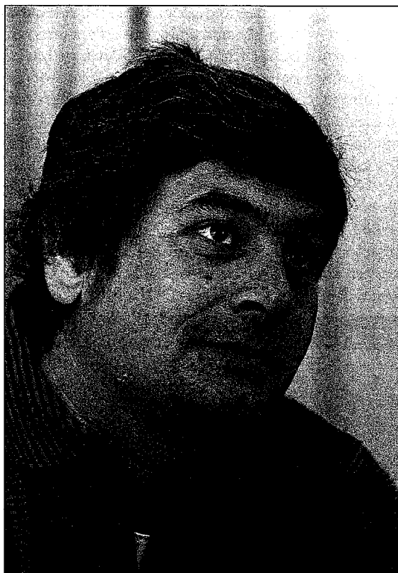
“Azken 20 urtetan errepideetan inbertitu den diru mordo trenbidean inbertitu izan balitz, gaur egun Gipuzkoan azpiegitura sare egokiago bat izango genuke”.

Jaizkibel mendiaren eta kostaren txikizioa izango litzateke. Gainera, kanpo aldeko Superportua egiteak geroari begira bi zentral termikoa egitea eskatuko luke, ingurumena areago zikintzea ekarriko lukeena. Gure proposamenak Pasaiaiko eskualdea eta inguruko auzokoan berritzea eskatzen du, berauetan lanpostuak sortuko dituzten enpresak eraikitzea. Esaterako, Valentzian Museo de las Ciencias y de las Artes delakoa egin da kanpoaldean. Herrian ere hori egin liteke. Zoritzarrez Gipuzkoako Diputazioaren politika Donostiako erdialdean inbertitzea da: Donostiako Aquariumak Pasaian egon beharko luke, bakailoaren historia eta itsasoarekiko harremana Pasaian dago. Aquariuma handitzean Urgull mendiari tokia jaten ari zaio, eta Pasaian badago toki nahikoa. Beste adibide batzuk: Santa Teresa eta San Telmo museoak, Tabakalera... Batzar Nagusietako eraikin berria Miramonen egiten ari da. Inbertsio handi eta erakargarri gutxiak Donostiako erdian egiten dira. Pasaia Donostia ondoan dago, eskualde horrek begirune gehiago behar luke. Ez da zaila, bai beharrezkoa ordea. Pasaiaiko eskualdearen garapena geldotuta dago eta etorkizuna izoztuta Aldundiaren helburu nagusia kanpoko Superportua eta eremu intermodalak ezartzea delako, eta hau ezin da onartu. ■