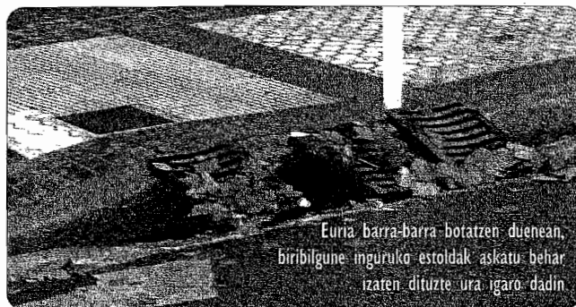
Euria barra-barra botatzen duenean, biribilgune inguruko estoldak askatu behar izaten dituzte ura igaro dadin.

E uria eta kimatu gabeko zuhaitzak. Hauexek dira, oraindik ere, auzotarren kezka nagusiak. Udazkeneko lehen egun euritsuek arazoak eragin dituztela salatu zuten bilerara bertaraturakoeak. Euria gogotik egiten duenean, euri-ura Mendiolatik ziztu bizian jaisten da, eta biribilgunean pilatzen da. Biribilguneak gainezka egin ez dezan, auzotarrek beraiek estoldak zabaldu behar izaten