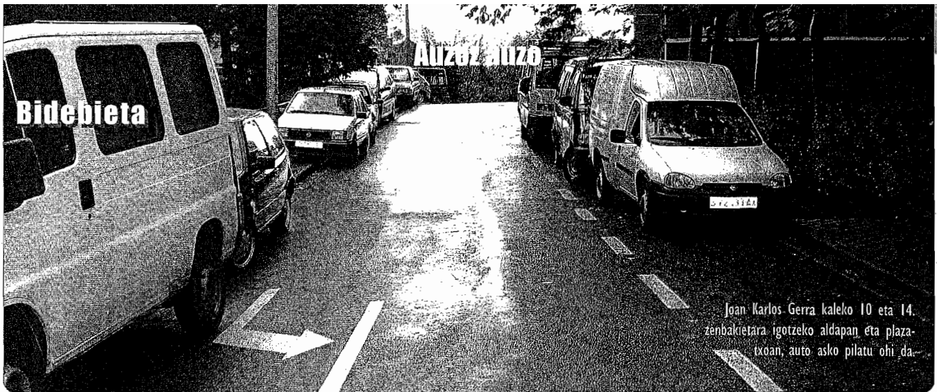
Joan Karlos Gerra kaleko 10 eta 14. zenbakietara igotzeko aldapan eta plaza-txoan, auto asko pilatu ohi da.