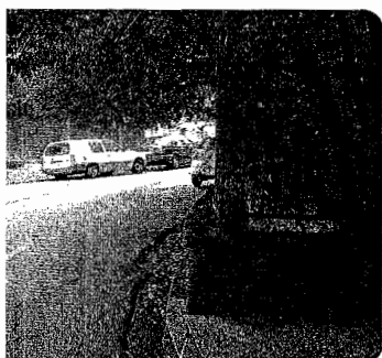
Auzotarrak kexu dira zenbait tokitan, tartean Zedro plazan, zuhaitzak aspaldi ez dituztelako kimatu

Asteak dira Joan Karlos Gerra kaleko parkeko hesi bat hondatu zela. Hesia lehenbait lehen konpondu behar dute. Izan ere, haurrak hortik atera ohi dira, parkearen atzealdeko kalera eroritako pilotak edo baloiak jasotzera. Bertan autoak ibiltzen dira, eta arriskua sor liteke.