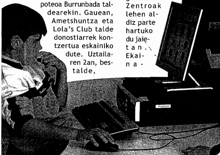
eDonostia.net zentroan haurrentzako internet ginkana egingo da