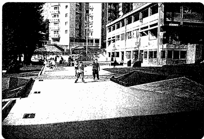
Elizaren atzealdean patinatzeo gunea dago.

Bistan denez, zaharberritutako parkeak harrera ona izan du auzotarren artean, eta baita ingurumarietatik datorren jendearen artean ere. Hori bai, mintzatu zaizkigun lagunek urmaeletako ura garbitu beharra, umeen jolastokia batzuetan txiki geratzen dela eta taberna bat jar litekeela aipatu digute. Horra hor, beraz, aintzat hartu beharreko proposamenak.