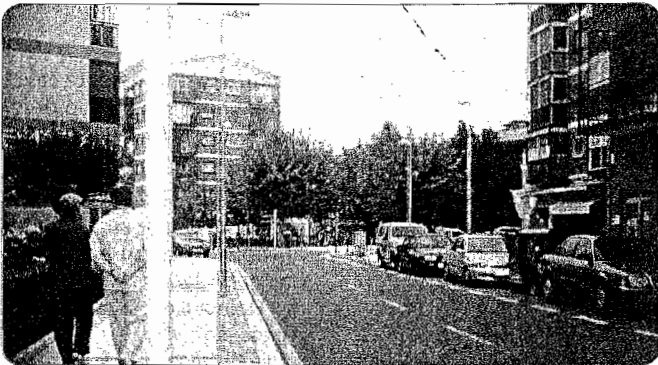
Gaur egun, Arriberrri kale hasieran, soilik alde batera utz daitezke autoak.

Udalak. Auzotarrek, ordea, eserlekuak lekuz alda ditzaten nahi dute. Batetik, eserlekuak zaborrontzien ondo-ondoan jarri izana salatu dute. Bestetik, bizilagunek diotenez, "eserlekuak dauden tokian haize-korrante handi samarrak izan ohi dira. Bankuetan batik bat zaharrak esertzen direla kontuan hartuta, komenigarria litzateke eserlekuak kalearen bestaldean jartzea". Hala egingo balute, gainera, gaur egun eserlekuen ondoan dagoen lorategitxo zabaltzeko aukera legoke, auzotarren iritziz. Azkenik, estalkirik ez duten bi zaborrontziei lehenbailehen estalkia jartzea nahi dute Arriberriko bizilagunek, "usain txarra darie eta".