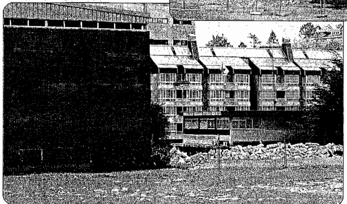
Eliza atzealdeko lurzorua ere berrituko da.

Parke berriak goialdea eta behealdea lotuko dituen bi pasabide izango ditu. Pasabide horiek parkean zehar ibiltzeko, eta batez ere, auzoko zonalde horren goialdea eta behealdea zeharkatzeko erabil-