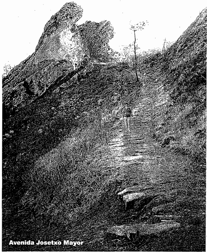
Avenida Josexo Mayor

La intersección de rutas, indica que se está a pocos metros de la loma del monte, un mirador que ofrece excepcionales vistas sobre Monpás y el mar. Fin de la variante.