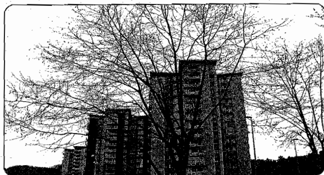
Auzotarrek zenbait zuhaitz aspaldi ez dituztela kimatu salatu dute.

Argazkiko eraikina Gaiztarroko Zumard pasealekuan dago, eta barnealdetik eraidatu berri dute. Eraikinean lanak egin aurretik Ramon Vizcaino enpresaren bulegoak zeuden bertan. Aipatu bulegoak kendu dituzte eta horien ordez 16 etxebizitza egokitu dituzte.