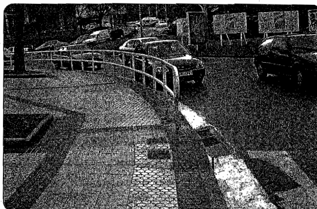
Euri-ura jasotzeko estolda handiagoak behar direla diote auzo elkarteak.

te bezala, euri asko ari duen bakoitzean, auzoko biribilgunean uholdeak izango direla uste dute. Izan ere, egungo estoldak ez dira gauza Mendiola-tik jaisten den euri-ura jasotzeko. Auzotarrek diotenez, "estolda gutxi daude auzoan, eta bakan batzuk kenduta, gainerako guztiak txikiegiak dira. Biribilgunearen inguruan arazoa are larriagoa da: oso estolda gutxi daude, eta daudenak segituan hostoz betetzen dira. Behin baino gehiagotan, auzotarrek etxetik jaitsi behar izaten dugu estoldak irekitzeko" . 2002ko abuztu amaieran izandako uholdeek kalte ugari eragin zituzten biribilgunearen inguruan. Ho-