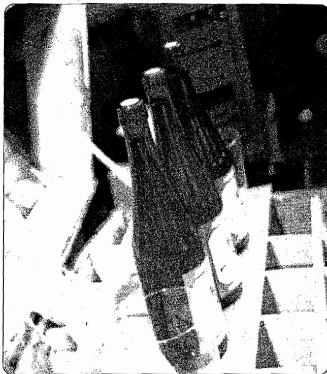
Larunbatean, hilak 7, Sagardo Eguna egingo da auzoan.