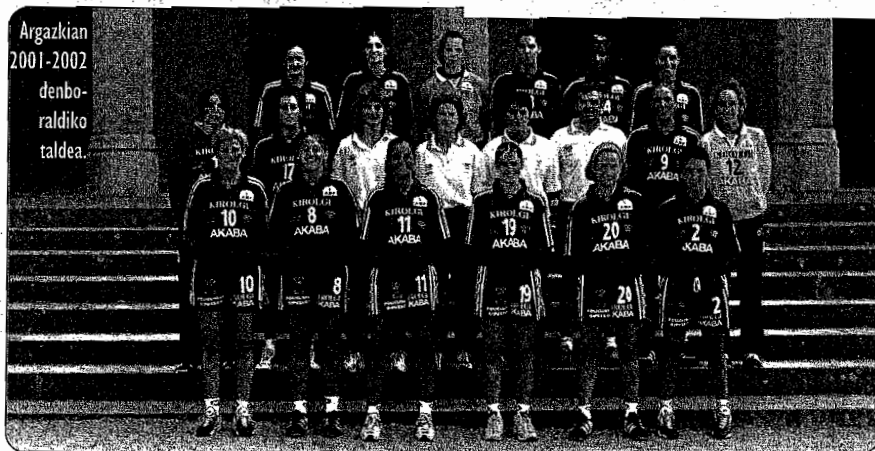
Argazkian 2001-2002 denboraldiko taldea.