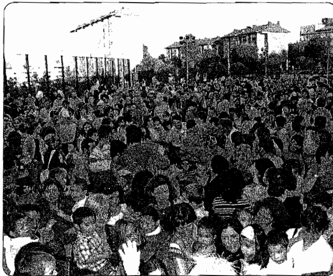
Auzo Elkarteek Astearen jende askok parte hartzea nahi dute antolatzaileek.