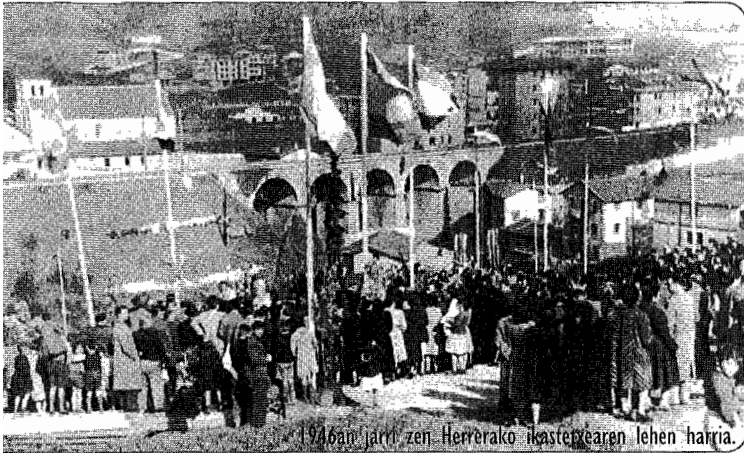
1946an jartri zen Herrerako ikastetxearen lehen harria.