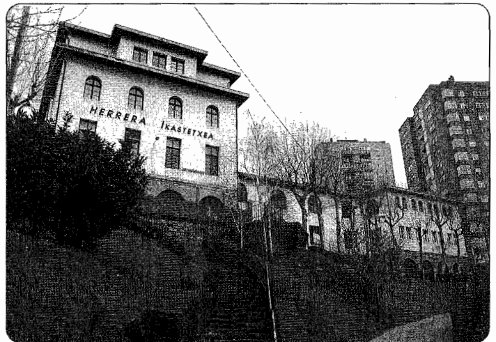
Urteurrenaren haritik hainbat ekitaldi egingo dira.

bait ekitaldi prestatzen ari dira. Ikastetxekoak aldizkari bat argitaratzeaz dira eta bestalde, eskolaren bilakaera jasotzen duen argazki erakusketa zabalduko dute Larratxoko kultur etxean. Datozen egunotan, bestalde, bi hitzaldi izango ditugu ikastetxean bertan. Martxoaren 7an, osteguna, Altzako Historia Mintegiko kideek Herrerako iragana, oraina eta etorkizuna izango dituzte hizpide. Hilaren 21ean, berriz, haurtzarotik nerabezarora igarotzeak ekarri ohi dituen arazoari buruzko solasaldia egingo da.