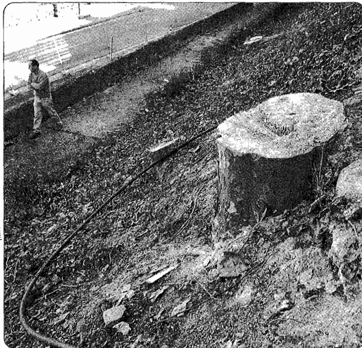
Platanondo ederrak moztu izanak erabat haserretu ditu Altzako bizilagunak.

«Legalki egindako txikizio honek ez du zentzurik» Joan Mari Irigoien