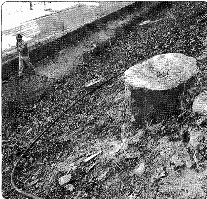
Platanondo ederrak moztu izanak erabat haserretu ditu Altzako bizilagunak.