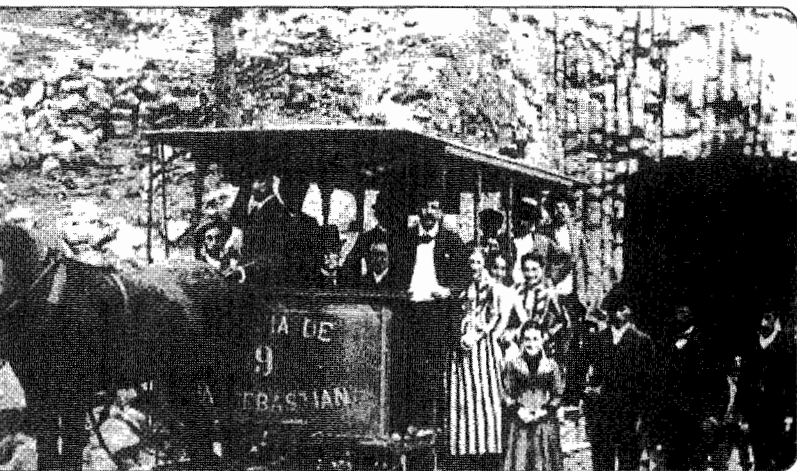
Gaur egungo garraio azkarrak ez zegoen garai bateko Altzan.