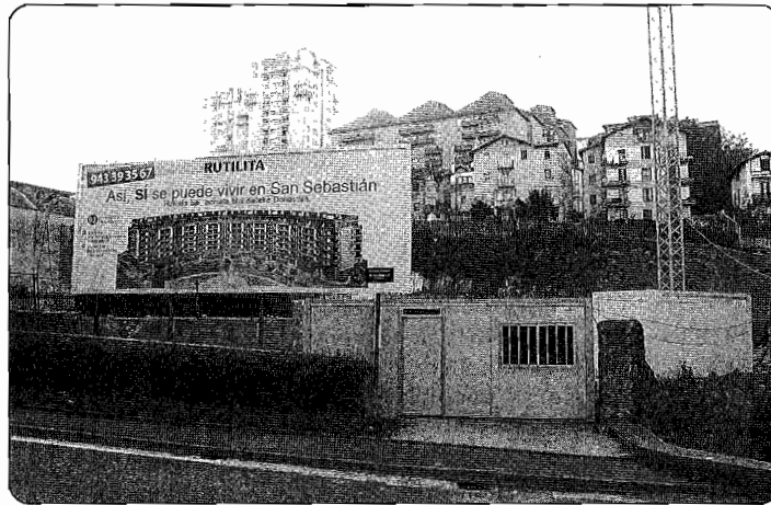
Herreran salmenta libreko 92 etxebizitza eraikitzen ari dira.

E gokitze lanak amaitutakoan, Lau Haizeta parkeak 98.000 metro karratu izango ditu, eta Larratxotik igarotzen den autopistaren azpiko tuneletik Lau Haizeta baserriraino zabalduko da. Bertan, haurrentzako jolastokiak eta paseoan ibiltzeko tokiak jarriko dituzte. Horrez gain, bertako errekatxoak eta basoa egokituko dira. Gainera, iturria eta zurezko pasabidea jarriko dituzte erreka ondoan. Horretarako, auzotarrak inguru horretan ziztuzten baratzak desagertarazi egin dituzte, eta jakina, auzoan ez da falta izan gaiaren inguruko esamesarik.