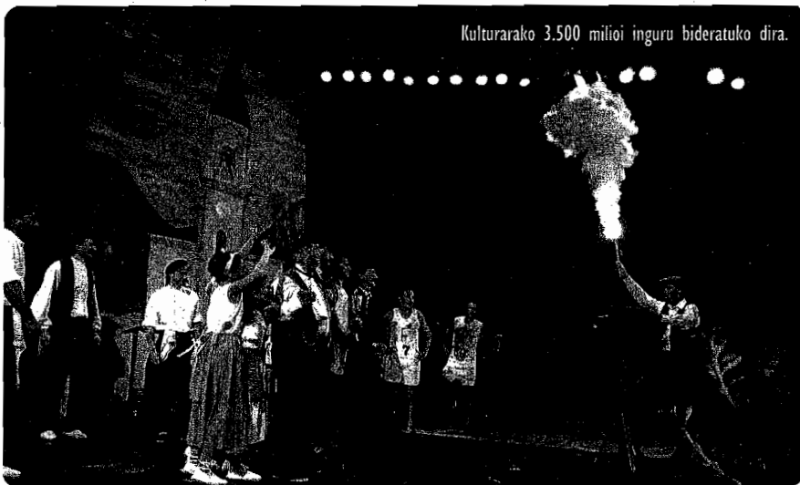
Kulturarako 3.500 milioi inguru bideratuko dira.

Oposizioko alderdi politikoek gogor kritikatu dute gastu arruntaren igoera. Zergei dagokienez, berriz, zaborra tasa %25 handitu da, eta horrek ere zeresan ugari eragin du alderdi politikoaren eta