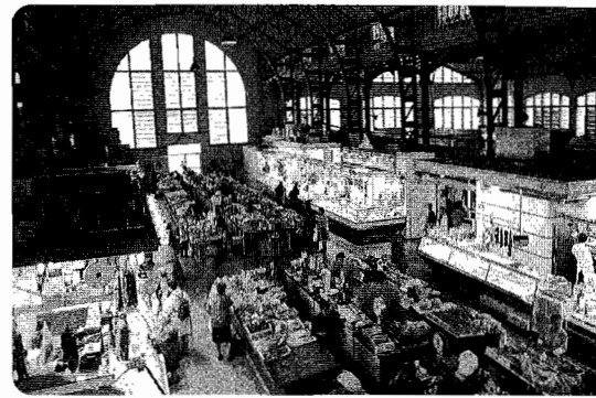
Aurtengo inbertsioen artean San Martin merkatuaren berrikuntza dago.

Elkarteei dagokienez, besteak beste, Unicef, Atzegi, Gipuzkoako Kontsumitzaileen Elkarte, Once, Emaus Fundazioa eta Gipuzkoako Merkataritza Ganbarak proposamenak aurkeztu dituzte. Auzo elkarteen artean, berriz, Herrera, Gros, Loiola, Txomin, Egia, Antigua, Añorga Txiki, Amara Berri eta Uliako auzo elkarte zuzenketak jaso dira, besteak beste.