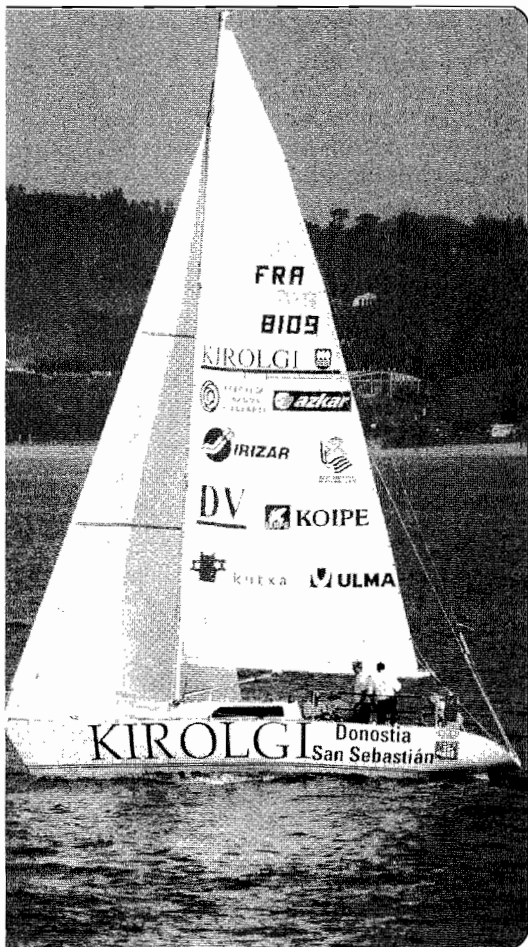
Argazkian Cadiz-Habana estropaden parte hartutako kirolgi belauntzia.

Itsasgizonek oroipen ugari ekarri dituzte Donostiara. Kirolgi belauntziaren patroiak dioenez, "Karibe itsasora Bahametatik iristea liluragarria izan zen. Gainera, Habanako jendeak estropadaren berri zuen, eta oso harrera ona egin zigten parte hartzaile guztioi" . 32 eguneko lehia eta gero, atsedena behar dute kirolari gipuzkoarrek, baina dagoeneko etorkizuneari pentsatzen hasiak dira. Aurrerantzean, Cadiz-Habana bezalako egitasmoetan parte hartzea da beraien helburua.