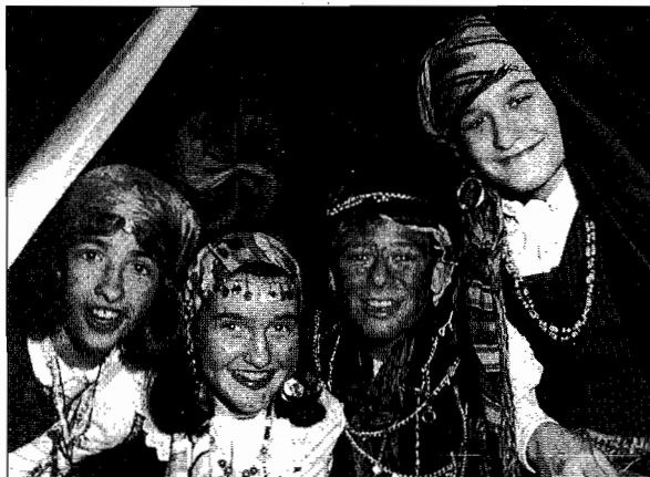
Beste auzoetan bezala, Altza-Herreran ere ibiliko dira pertzagileak

d atorren larunbatean, hilak 3, arratsaldeko 18.00-etatik aurrera, kaldereroen konpartsa auzoko kaleetan barrena ibiliko da. Urtero bezala, altzatarrek ijitoz jantzita zartaginaz eta mailuaz lagunduta, kaldereroen pantomima auzoratuko digute. Aipatu beharra dago Herreran gero eta festa gutxiago egiten dela. Hala eta guztiz, kaldereroen jaiaren parte hartze handia duen bakkarrenetakoa da. 60-70 lagun inguru atera ohi dira konpar-