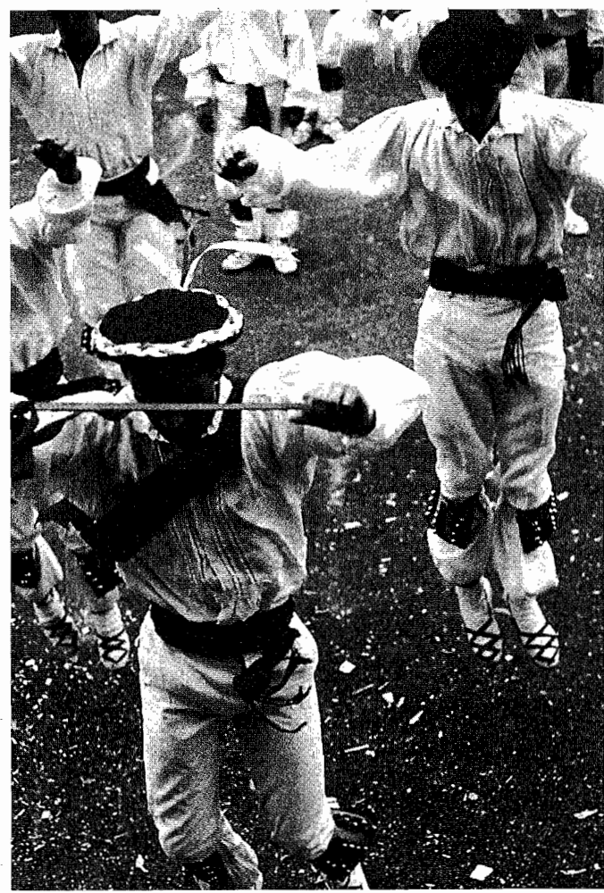
Hilaren 16an, larunbata, folklore jaialdia egingo da, Eskola taldearen eskutik

nabarmentzeko da igandean, hilak 17, egingo den kros herrikoa. Lasterketak guztira, zortzi kilometrotako ibilbidea du, eta bertan emakumezkoek zein gizonezkoek parte